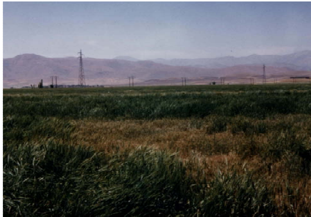
شکل ۱. مزرعه گندم مبتلا به پوسیدگی ریشه و طوقه در اثر شبه جنس Bipolaris