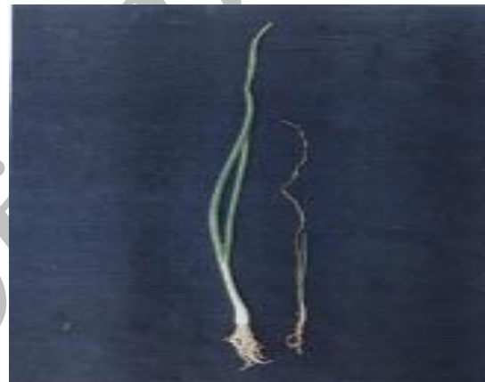
تصویر ۲. گیاهچه‌های پیاز آلوده به بیماری ریشه سرخی (بالا)، پیازهای بالغ آلوده به بیماری (پایین)

و بنفش رنگ شده و از بین رفته بودند و به راحتی از طبق گیاه پیاز جدا می‌شدند. در این خصوص، دو توده صفی‌آباد رامهرمز و سرباز بلوچستان قرار داشتند و از لحاظ طبقه‌بندی در طیف سوم (۲-۳) واقع شدند. این دو توده، از حساس‌ترین توده‌های مورد آزمون در این بررسی‌ها هستند که در این جا معرفی می‌گردند. بررسی‌هایی که سایر پژوهشگران در این خصوص ارائه نموده‌اند نیز به همین صورت عمل نموده و بعضاً در شرایط مزرعه و یا به صورت پلات‌های کوچک آلوده، انجام داده‌اند و ارقام و توده‌های مورد آزمون مربوطه خود را نسبت به این بیماری ارزیابی کرده‌اند (۸، ۱۰، ۱۱، ۱۴، ۱۵ و ۲۶).