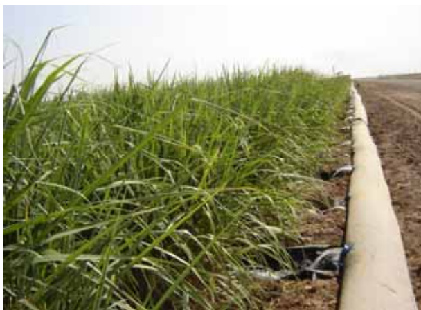
تصویر ۲. لوله هیدروفلوم در حالت آبیاری یک جویچه در میان