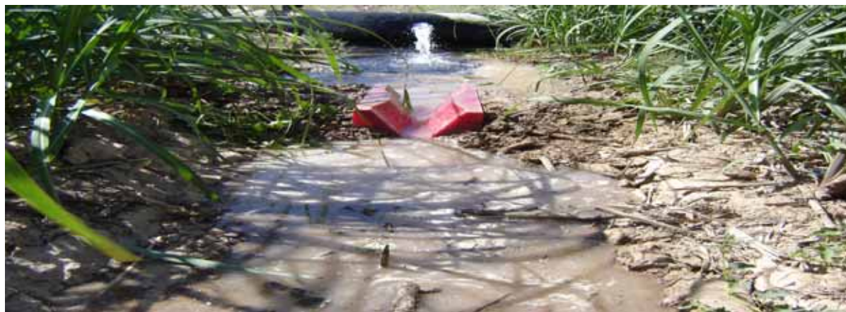
تصویر ۳. خروج آب از فلوم و پیشروی آب در جویچه