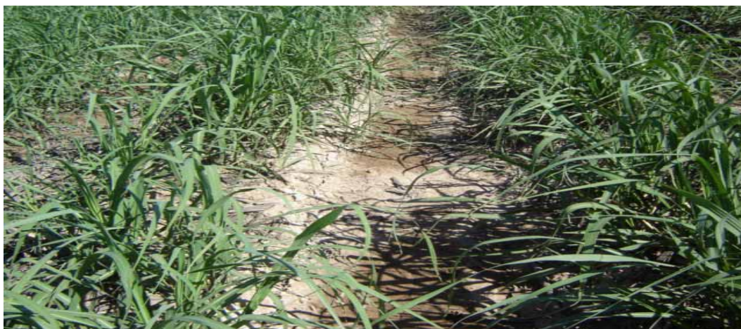
تصویر ۴. نحوه جریان آب از یک جویچه آبیاری شده به یک جویچه آبیاری نشده