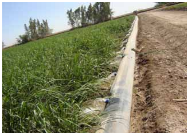
تصویر ۱. لوله هیدروفلوم در حالت آبیاری کامل

تیمار آزمایشی حدود ۱۰۰ متر مربع در طول شیار و از سه مکان مختلف، برداشت دستی صورت گرفت و تعداد نی در این محدوده نیز شمارش و به تن در هکتار و تعداد نی در هکتار تعمیم داده شد. هم‌چنین نمونه‌های ۲۰ نی (از هر تیمار سه نمونه ۲۰ نی به صورت تصادفی) جهت تعیین ویژگی‌های نیشکر از تیمارهای آزمایشی در موقع برداشت تهیه و پس از توزین و اندازه‌گیری ارتفاع آنها، با استفاده از دستگاه عصاره‌گیری از آنها عصاره‌گیری و با استفاده از دستگاه‌های ساکاریمتر و پلاریمتر مدل سوما، فاکتورهای کیفی چون درصد ساکاروز شربت نی (POL) و مقدار ذرات جامد محلول در شربت نی (Brix) اندازه‌گیری و با توجه به این فاکتورها، ویژگی‌های کیفی دیگر محاسبه شد. در پایان با توجه به حجم آب مصرفی و نیشکر و شکر تولیدی، کارایی مصرف آب برای هر تیمار محاسبه و تیمارها با هم مقایسه شدند.