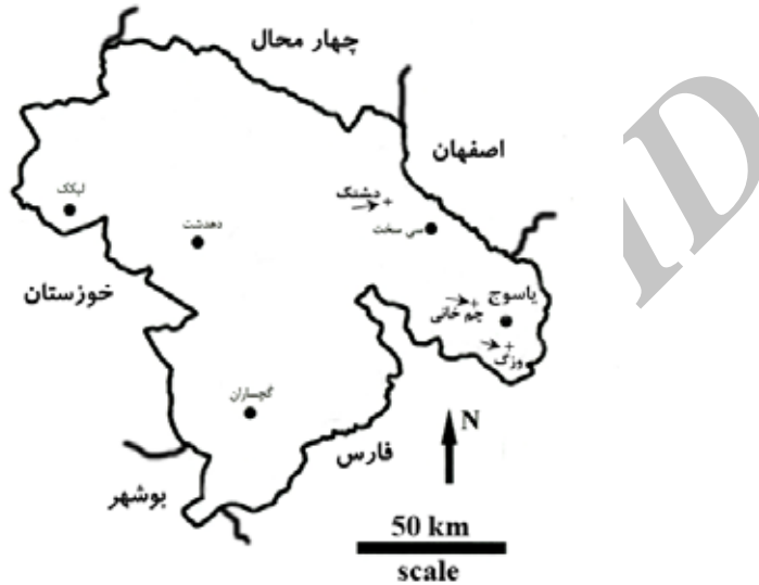
شکل ۱. موقعیت مناطق مطالعاتی در استان کهگیلویه و بویراحمد (نشان داده شده با پیکان)

تفاوت میان میزان کربنات کلسیم معادل در خاک سایه‌انداز و خارج آن در مناطق مطالعاتی الگوهای متفاوتی را نشان داده است. در حالی که این اختلاف در منطقه وزگ بی معنی بوده و در مناطق دشتک و چمخانی به ترتیب در سطوح ۱٪ و ۵٪ معنی‌دار بوده است. تغییرات میزان کربنات کلسیم معادل نسبت به عمق نیز در هر سه منطقه معنی‌دار بوده است. نتایج به دست آمده نشان می‌دهد که میانگین میزان کربنات کلسیم معادل در عمق ۲۰-۵۰ سانتی‌متر مناطق وزگ و چمخانی و اعماق ۲۰-۴۰ و ۴۰-۶۰ سانتی‌متر خاک منطقه دشتک معنی‌دار بوده است. در سایر مناطق و عمق‌ها میانگین اختلاف‌ها معنی‌دار نبوده است (جدول‌های ۲ و ۴). تفاوت میان میزان کربن آلی و نیتروژن کل در خاک سایه‌انداز و خارج آن و هم‌چنین بین