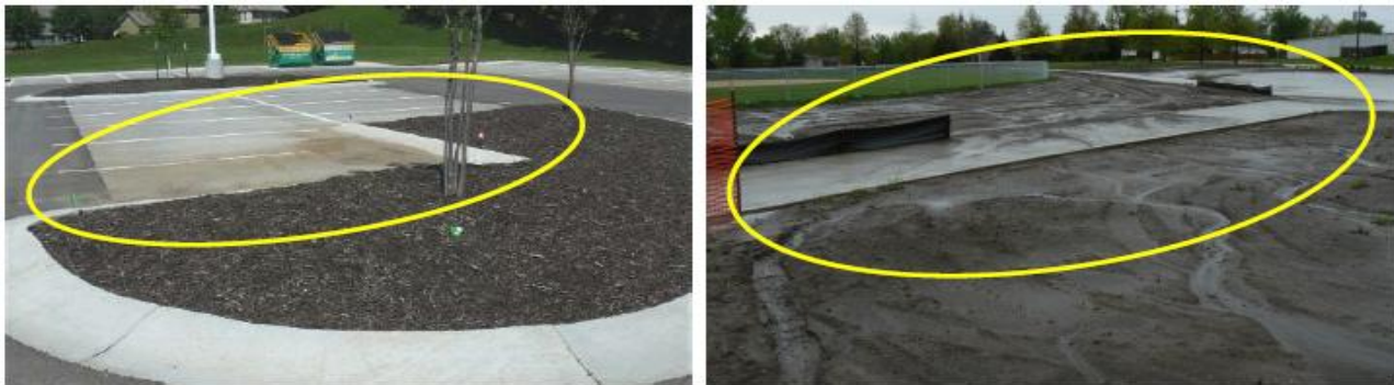
شکل ۱. رواناب ایجاد شده روی سنگ‌فرش معمولی و عدم تشکیل آن روی سنگ‌فرش متخلخل (۲۵)