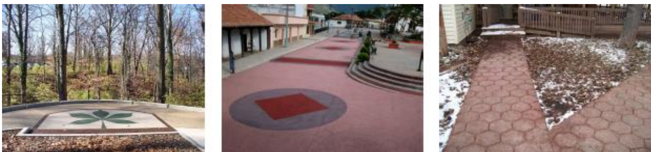
شکل ۲. نمونه‌هایی از فضا سازی با سنگ‌فرش بتنی متخلخل رنگی (۲۴)

تیموری و همکاران (۲۵) به بررسی خواص فیزیکی و پارامترهای کیفی بتن متخلخل حاوی جاذب‌های پرلیت، پوکه معدنی، لیکا و زئولیت برای کاهش میزان و کیفیت رواناب شهری پرداختند. نتایج به‌دست آمده نشان داد که برای تمام تیمارهای با جاذب‌های مختلف، با افزایش مقدار ریزدانه، مقدار مقاومت فشاری افزایش، و تخلخل و ضریب نفوذپذیری کاهش می‌یابد. همچنین، با افزودن ریزدانه، درصد حذف پارامترهای کیفی رواناب زیاد می‌شود.