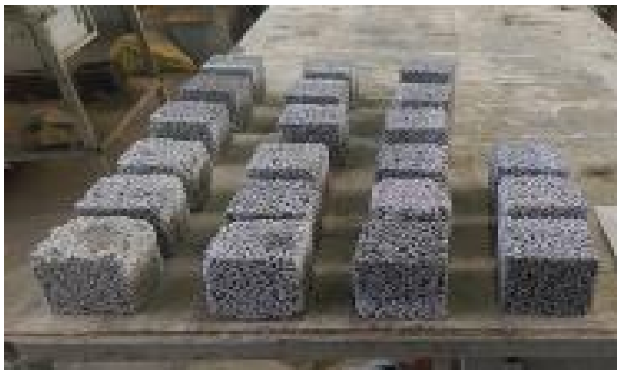
شکل ۴. نمونه‌های بتن متخلخل ساخته شده برای انجام آزمایش مقاومت فشاری