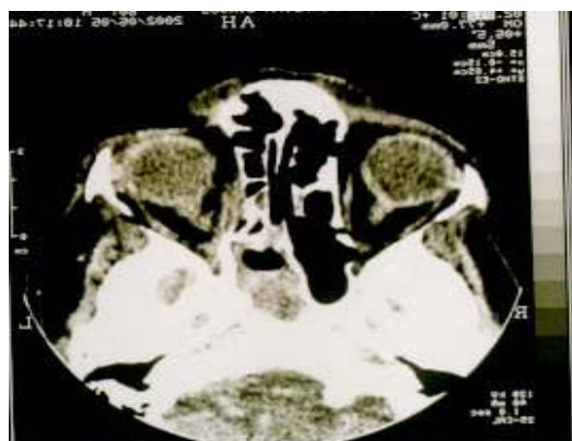
تصویر F : CT Scan در مقطع اگزایال بعد از جراحی

نتایج معاینه چشم ها بعد از عمل جراحی در جدول ۲ آورده شده است.