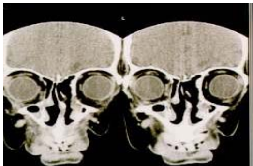
تصویر E : CT Scan در مقطع کروئال بعد از جراحی

آنگاه لامینا پایراسه و قسمتی از کف اربیت برداشته شد و توده نمایان گردید. سپس توده که چسبندگی به اطراف داشت کاملاً جدا شده و به طور کامل خارج گردید و نمونه به آزمایشگاه پاتولوژی فرستاده شد که پسودولنفوما گزارش گردید (تصویر E, F).