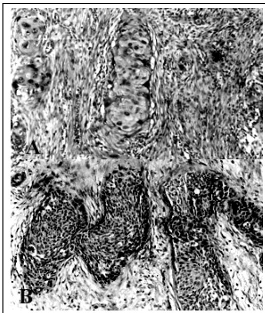
شکل ۲: تهاجم بافت نئوپلاستیک اسکوآموس سل کارسینوما به استرومای زیرین و لایه های عضلانی دیواره کیسه صفرا (بزرگنمایی ۲۰۰×)

درجه حرارت ۳۷/۲ درجه سانتیگراد، تعداد نبض ۹۰ تا در دقیقه، تعداد تنفس ۲۴ تا در دقیقه و فشار خون ۱۲۵/۷۵ میلیمتر جیوه داشت. بیمار در سابقه پزشکی خود بیماری فشار خون تحت درمان را دارد.