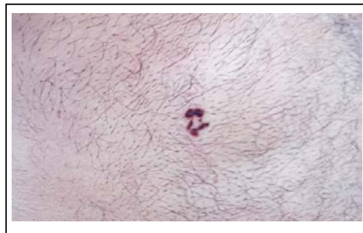
شکل ۲: سرطان سلول قاعده ای روی شکم

میزان درگیری ساعد و دست ۸ مورد BCCs را شامل می‌شد که ۵ مورد (۱۰/۴٪) در نواحی ساعد و ۳ مورد (۶/۳٪) در دست‌ها قرار داشتند. از ۱۱ مورد BCCs اندام تحتانی، ۱ مورد (۲/۱٪) روی کپل، ۲ مورد (۴/۲٪) در ران‌ها، ۳ مورد (۶/۳٪) روی ساق، ۳ مورد (۶/۳٪) روی پاها و ۲ مورد (۴/۲٪) در کشاله ران قرار داشتند. از ۲ مورد BCCs (۴/۲٪) ناحیه تناسلی خارجی، هر ۲ مورد بر روی ولو قرار داشتند.