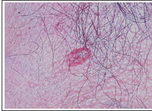
شکل ۱: سرطان سلول قاعده ای روی سینه

از ۲۷ مورد BCCs تنه، ۸ مورد (۱۶/۷٪) در قفسه صدری (شکل ۱)، ۵ مورد (۱۰/۴٪) روی شکم (شکل ۲)، ۳ مورد (۶/۳٪) در پشت، ۲ مورد (۴/۲٪) در زیر بغل، ۳ مورد (۶/۳٪) در پستان‌ها، ۶ مورد (۱۲/۵٪) روی شانه‌ها قرار داشتند.