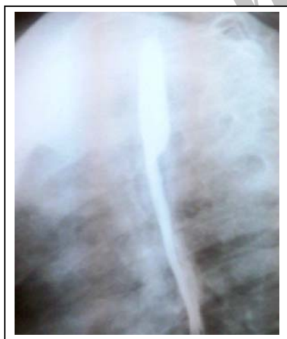
تصویر ۱: تصویر برداری بلع باریم

با وجود بهبود بالینی واضح دیسترس تنفسی و مساعد شدن حال عمومی و قطع تب، همچنان ویزینگ بیمار ادامه داشت. در بررسی مدارک پزشکی قبلی بیمار مشخص شد در رادیوگرافی بلع باریم تحت فلوروسکوپی وجود اثر فشاری ثابت در خلف مری (fixed posterior indentation) وجود دارد (تصویر ۱).