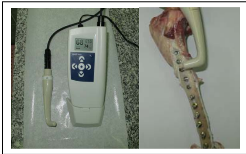
شکل ۳: اندازه گیری توسط دستگاه Osstell

روش تهیه حفرات بر اساس دستور العمل کارخانه سازنده انجام پذیرفت، از دریل های pilot شروع شده و به صورت پیوسته قطر دریل ها افزایش یافت تا به سایز نهایی برسد. برای قرار دهی ایمپلنت ها از تورک ۳۰ نیوتن بر سانتی متر مربع شروع کرده و در صورت مقاومت ۵ واحد به میزان آن افزوده می شود تا در نهایت ایمپلنت کل طول نهایی خود در حفره را طی کند. به منظور جلوگیری از خطا در دریل کردن حفرات تمامی اتصالات بافت نرم و عضلانی و پریوست از روی استخوان کنده شدند و به منظور جلوگیری از تخریب استخوان و تغییر خواص آن به دلیل حرارت زیاد، عمل دریل کردن با اعمال شست و شوی فراوان انجام پذیرفت. ثبات اولیه توسط دستگاه osstell مورد ارزیابی قرار گرفت ( شکل ۳).