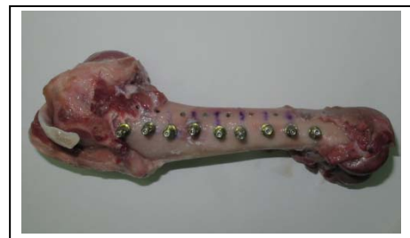
شکل ۲: جایگذاری کامل نمونه های ایمپلنتی در استخوان

مجموعاً ۳۲ عدد ایمپلنت (Eurotecnica, France) با قطر ۴/۵ در طول ۸ میلی متر در استخوان ها جایگذاری شدند (شکل ۲).