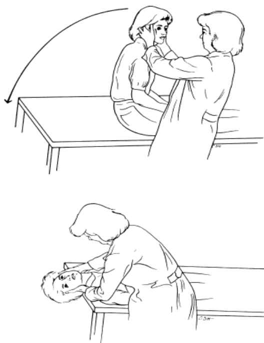
شکل ۱: نحوه انجام مانور هالپایک

ابزار غربال بیماران مبتلا به سرگیجه آزمون هالپایک بود (شکل ۱).