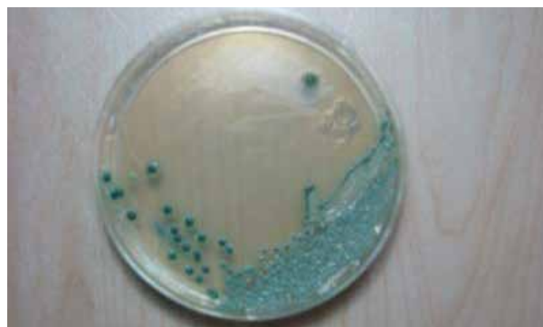
تصویر ۱: کلنی‌های سبز رنگ کاندیدا آلبیکنس بر روی محیط اختصاصی کروم آگار

بررسی اثرات غلظتهای مختلف داروی فلوکونازول در محدوده ۰/۲۵ تا ۱۲۸ میکروگرم در میلی لیتر بر رشد مخمرهای کاندیدا آلبیکنس نشان داد که این دارو از طریق وابسته به غلظت قادر به مهار رشد ارگانیسما در برخی از غلظتهای به کار گرفته شده می‌باشد. میانگین مقادیر MIC و MFC جدایه‌های کاندیدا آلبیکنس به ترتیب ۲۸/۸ تا ۵۴ میکروگرم در میلی لیتر و ۳۳/۲۵ تا ۹۰ میکروگرم در میلی لیتر بودند. میانگین میزان MIC فلوکونازول برابر جدایه‌های مختلف کاندیدا آلبیکنس حدود ۴۵/۳۸ میکروگرم در میلی لیتر بود، درحالی که میانگین میزان MFC برابر ۶۳ میکروگرم در میلی لیتر محاسبه شد (جدول ۲). تمام جدایه‌های کاندیدا آلبیکنس حساس وابسته به دوز بودند.