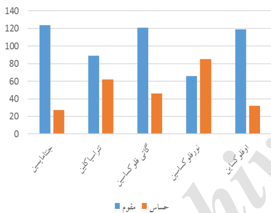
شکل ۱: فراوانی الگوی مقاومت آنتی‌بیوتیکی ایزوله‌های بالینی استافیلوکوک اورئوس

در مجموع ۱۵۱ ایزوله استافیلوکوک اورئوس مقاوم به متی‌سیلین از ۳۰۲ ایزوله بالینی استافیلوکوک اورئوس، ایزوله (۵۰ درصد) دارای قطر هاله ۲۱ یا کمتر و مقاوم به سفوکسیتین بودند که با توجه به CLSI به عنوان سویه‌های مقاوم به متی‌سیلین در نظر گرفته شدند. از این میان، ۱۴۸ ایزوله (۴۹/۲ درصد) دارای قطر هاله ۲۱ و مقاوم به اوگزاسیلین بودند. همچنین برای آنتی‌بیوتیک‌های کیئونولونی، ۵۱ ایزوله (۷۸/۸۳ درصد) دارای قطر هاله کمتر از ۱۸ و مقاوم به نورفلوکساسین، ۶۶ ایزوله (۴۳/۷۳ درصد) دارای قطر هاله کمتر از ۱۸ و مقاوم به گاتی‌فلوکساسین و ۱۲۱ ایزوله (۸۰/۱۳ درصد) دارای قطر هاله ۱۸ و مقاوم به اوفلوکساسین بودند (شکل ۱، ۲).