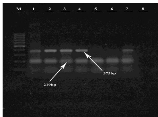
شکل ۳: نتیجه الکتروفورز تکثیر موفقیت آمیز محصولات ژن های griB و griA با طول آمپلیکون ۲۱۹ جفت باز برای ژن griA و ۳۷۵ جفت باز برای ژن griB بر روی ژل آگارز ۲/۵ درصد. چاهک ۱ تا ۶ نمونه های مثبت از نظر حضور ژن ها، چاهک ۷ کنترل مثبت، چاهک ۸ کنترل منفی، چاهک M مارکر با طول ۱۰۰ جفت باز

فراوانی ژن های وابسته به عوامل مقاومتی به فلوروکوئینولون ها و پمپ های افلاکسی بصورت زیر بود که ژن norA در ۳۹ ایزوله بالینی (۲۵/۸۲ درصد)، ژن norB در ۱۲ ایزوله بالینی (۹/۹۷ درصد)، ژن norC در ۴۱ ایزوله بالینی (۴۹/۱۵ درصد).