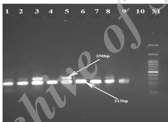
شکل ۴: نتیجه الکتروفورز تکثیر موفقیت آمیز محصولات ژن های gyrB و gyrA با طول آمپلیکون ۲۲۵ جفت باز برای ژن gyrA و ۲۵۰ جفت باز برای ژن gyrB بر روی ژل آگارز ۲/۵ درصد. چاهک ۱ تا ۴ و ۹ تا ۱۰ نمونه های مثبت از نظر حضور ژن ها، چاهک ۵ کنترل مثبت، چاهک ۱۰ کنترل منفی، چاهک M مارکر با طول ۱۰۰ جفت باز.