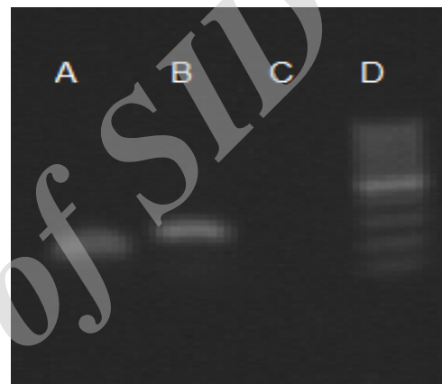
شکل ۱: A: بتا-اکتینین؛ B: ADAMTS-1؛ C: NTC؛ D: Ladder

علاوه بر این، مناسب‌ترین مقدار Cut off روی نقاط منحنی ROC با استفاده از اندکس youden (حساسیت + [۱۰۰ - ویژگی]) با محاسبه حداکثر مقدار تعیین گردید. در این راستا، مناسب‌ترین نقطه Cut off برای میزان \Delta CT ژن مذکور، ۵/۱۴ پیشنهاد می‌گردد.