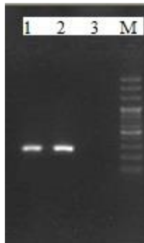
شکل ۳: نتیجه آزمایش PCR برای شناسایی ژن blaTEM