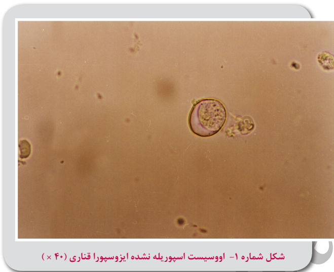
شکل شماره ۱- اووسیست اسپوریله نشده ایزوسپورا قناری (۴۰×)

طوطی (۷۱/۴٪) آلوده به تخم نامتود (با متوسط طول و عرض ۶۰×۴۰ میکرون) بودند. آلودگی بسیار کم و تعداد تخم شمارش شده از ۱-۲ تخم در هر گرم مدفوع بیشتر نبود. با توجه به شکل بیضی، توده سلولی تقسیم نشده و اندازه تخم، آلودگی را می توان به گونه های اسکاریدیدا نسبت داد. آلودگی به ایزوسپورا در ۱۰۰ قطعه قناری (۴۷/۶٪) مشاهده شد (پس از کشت مدفوع اووسیست های اسپوریله ایمریا و ایزوسپورا به راحتی از هم تفکیک می شوند، اووسیست اسپوریله ایزوسپورا دارای دو اسپوروسیست که هر یک چهار اسپوروزوئیت دارند و اووسیست اسپوریله ایمریا واجد چهار اسپوروسیست است که هر یک دو اسپوروزوئیت دارند. (۱۵) (شکل شماره ۱ و ۲) (جدول شماره ۱). از ۱۰۰ قطعه قناری آلوده به ایزوسپورا در ۷۵