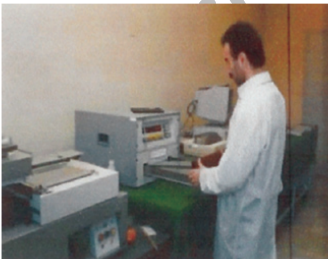
عکس شماره ۲

یکی از دلایل بررسی تعداد دفعات پشم‌چینی تاثیری که ممکن است