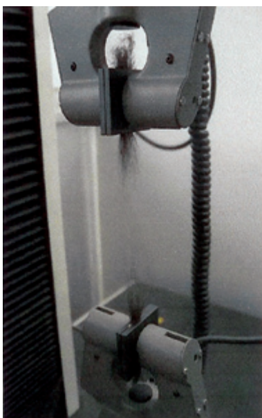
عکس شماره ۴