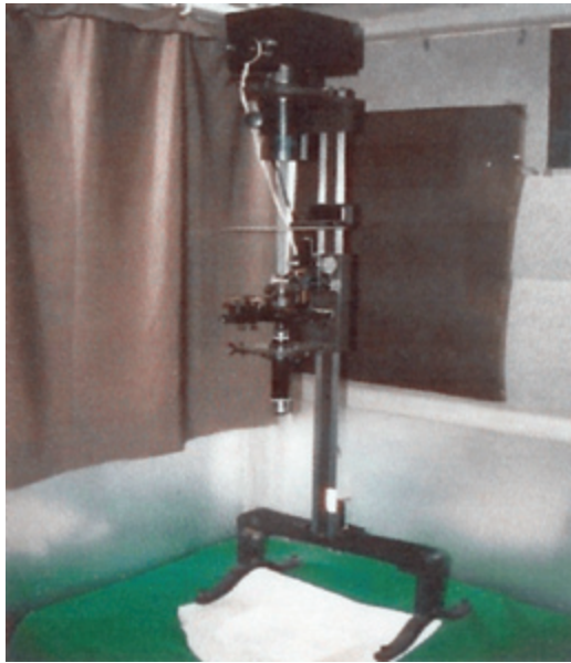
عکس شماره ۱

نهائی تاثیر نداشت. طول دسته الیاف پشم در بهار در سه ناحیه شانه، پهلو، کیپل و مجموع آنها تحت تاثیر دفعات پشم‌چینی ( p < 0/0001 ) قرار داشت در حالی که تحت تاثیر سال و اثر متقابل سال و دفعات پشم‌چینی نبود. اثر دفعات پشم‌چینی و اثر متقابل آن با سال روی سایر خصوصیات پشم از جمله طول الیاف، قطر و ضریب تغییرات آن، تناسیتی و بارپارگی معنی‌دار نبود ولی سال اثر معنی‌دار ( p < 0/05 ) داشت.