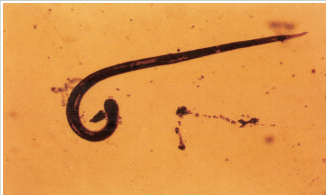
شکل ۳- Camallanus Lacustris بزرگنمایی ۲۰