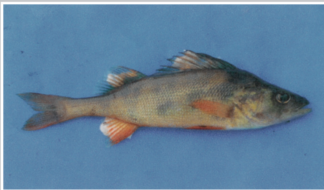
شکل ۱- سوف حاجی طرخان ( perca fluviatilis )