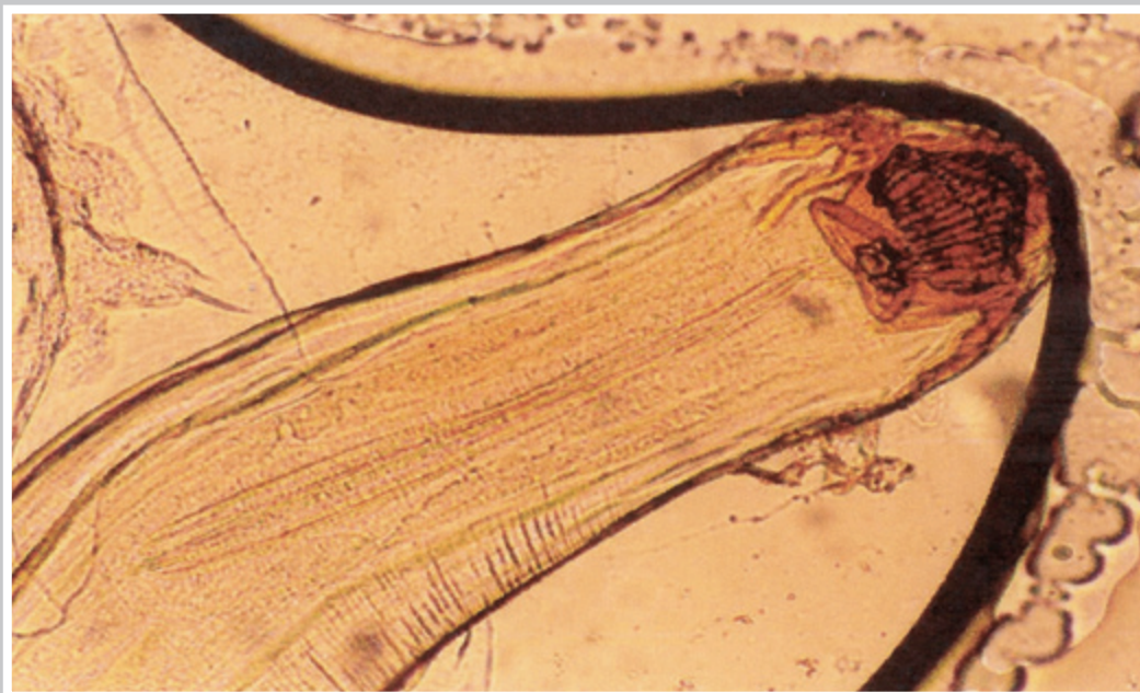
شکل ۴- Camallanus Lacustris (قسمت سر) ، بزرگنمایی ۴۰