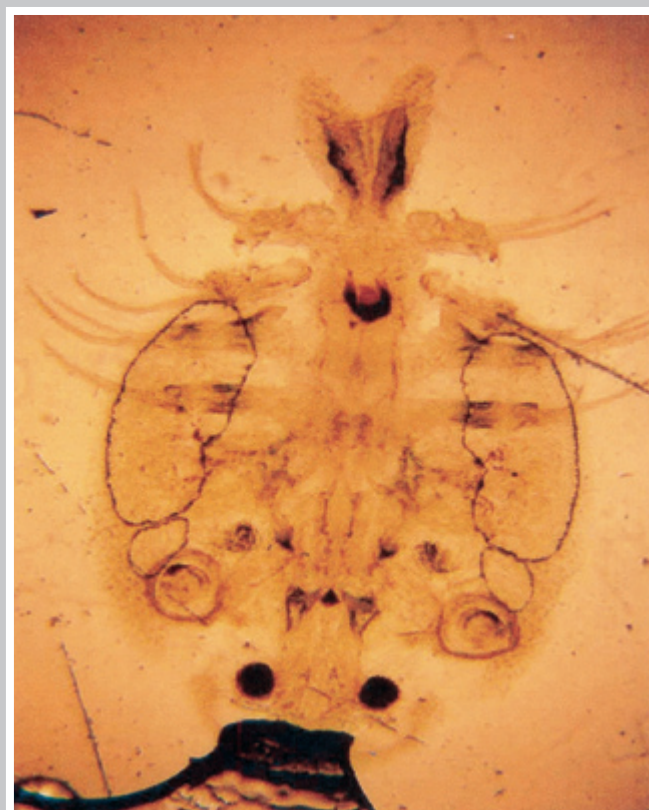
شکل ۶- آرگولوس، بزرگنمایی ۱۰