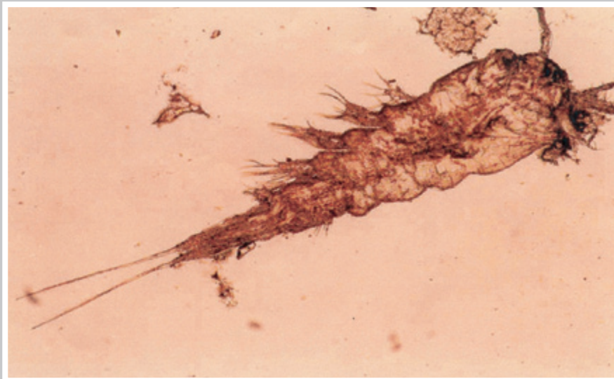
شکل ۵- مرحله پاروپایی لرنه آ، بزرگنمایی ۲۰