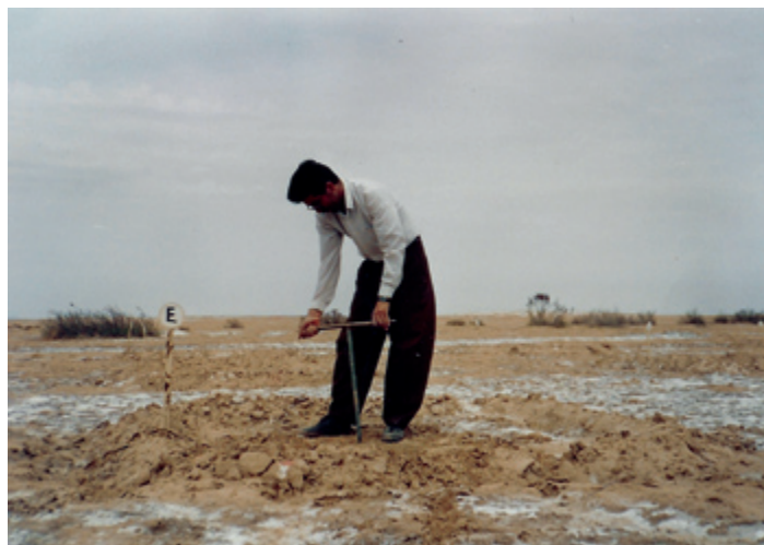
تصویر ۱- منطقه کویر نمک بجنستان

که بخش قابل ملاحظه‌ای از املاح محلول و متراکم شده در خاک در اثر عمل آیشویی از پروفیل خاک خارج گردد اثرات سوء سدیم تبادلی ۱ (EXNa + ) در اکثر حالات نمودار شده و موجبات گسیختگی خاکدانه‌ها و تخریب ساختمان خاک را ضمن استمرار عملیات آیشویی فراهم می‌آورد (۲). از بررسی نتایج تجزیه خاک قبل و بعد از آیشویی ملاحظه می‌شود خاک مورد نظر روند قلیا شدن را که منجر به تخریب ساختمان فیزیکی خاک و کاهش نفوذپذیری خاک می‌گردد را در پیش نگرفته و بدون استفاده از ماده اصلاح کننده، فقط با آیشویی قابل اصلاح