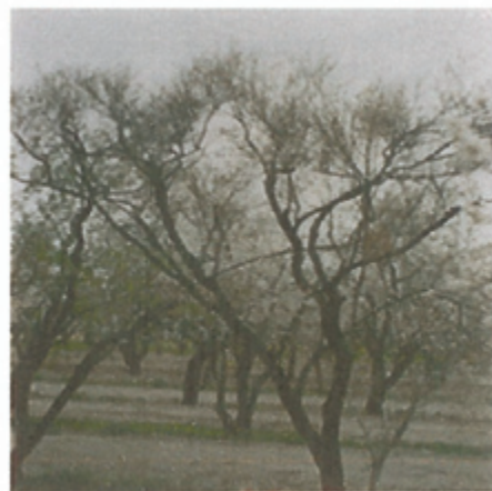
شکل ۱- هیبرید ارچن × بادام و میوه آن