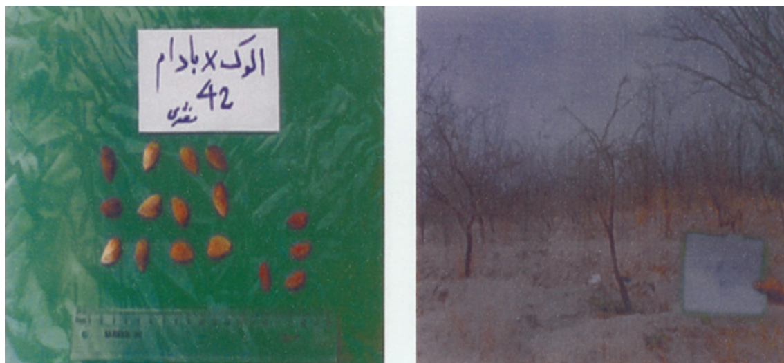
شکل ۳- هیبریدالوک × بادام و میوه آن

بوده است و در صورتی که بذور آزاد گرده افشان هیبرید هلو- بادام تولید نهال‌های غیریکنواخت می‌کنند که شاید ناشی از هتروزیس باشد (۱۱،۹) گونه‌های مختلف بادام و هیبریدهای بین گونه‌ای از لحاظ صفات یاد شده و خیلی از صفات دیگر با هم اختلاف دارند و به عبارتی از یک نوع تنوع (دامنه‌ای از اختلاف و تفاوت‌های موجود بین مجموعه‌ای از موجودات مشابه) برخوردار هستند و این تنوع باعث ایجاد تغییر تکامل و سازگاری گیاه با مناطق و شرایط مختلف شده است. امروزه دستیابی به ارقام و گونه‌ها با صفات مهمی همچون مقاومت به آفات و بیماری‌ها، تنش‌های محیطی و غیره یکی از اهداف مهم اصلاحی می‌باشد و در هر برنامه اصلاحی، وجود این نوع مواد ژنتیکی از عوامل عمده موفقیت می‌باشند. بر این اساس برای شناسایی ارقام و گونه‌ها و