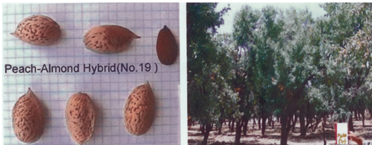
شکل ۲- هیبرید هلو × بادام و میوه آن

دیرگلی هیبرید هلو- بادام به خاطر نیاز سرمایی نسبتاً زیاد هلو می‌باشد. اندازه و رنگ گل در هیبریدها متفاوت بوده به طوری که رنگ گل در هیبرید هلو- بادام سفید کرم رنگ بوده که بیانگر به ارث بردن رنگ گل صورتی از هلو می‌باشد. سایر گزارش‌ها (۸،۱) نیز نشان می‌دهد اندازه، شکل و رنگ گلبرگ و تعداد پرچم‌ها متغییر بوده و همچنین رنگ و اندازه برگ‌ها نیز تا حدودی متفاوت باشند. گرچه وراثت‌پذیری تعداد پرچم در نتاج کم می‌باشد.