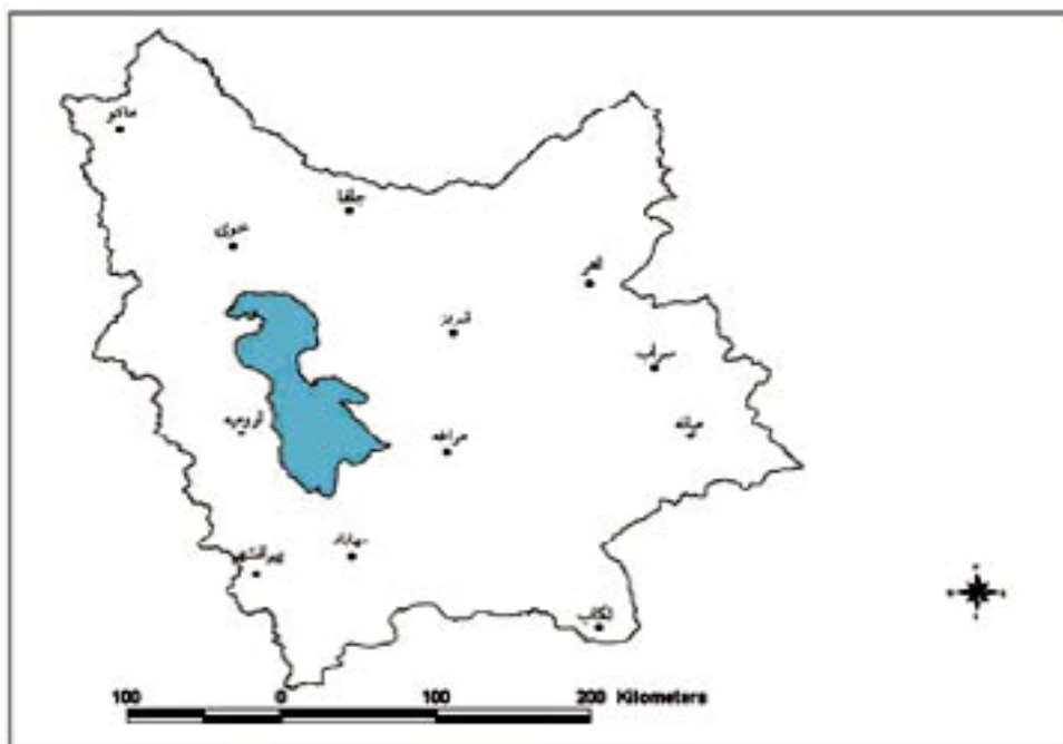
شکل (۱): موقعیت ایستگاه‌های سینوپتیک مورد مطالعه در استانهای آذربایجان غربی و شرقی

فرارفتی تصادفی بوده و به صورت نرمال توزیع یافته‌اند. در بررسی حاضر ماهیت اولین یخبندان پاییزه و آخرین یخبندان بهاره با بکارگیری گزارشات ساعتی پارامترهای جوی همراه با نقشه‌های همدیدی تشخیص داده شد و با استفاده از اطلاعات حاصله طول فصل رشد بالقوه تعریف گردید. با تعیین تاریخ‌های آغاز و خاتمه یخبندانهای فرارفتی، امکان مبارزه با یخبندان در نواحی مختلف استان قابل ارزیابی می‌گردد. در این بررسی گزارشات آماری ۱۲ ایستگاه سینوپتیک (۱) واقع در استانهای آذربایجان غربی و شرقی مورد استفاده قرار گرفت. نقشه و محل ایستگاهها در شکل ۱- و مختصات جغرافیائی آنها در جدول ۱- ارائه گردیده است