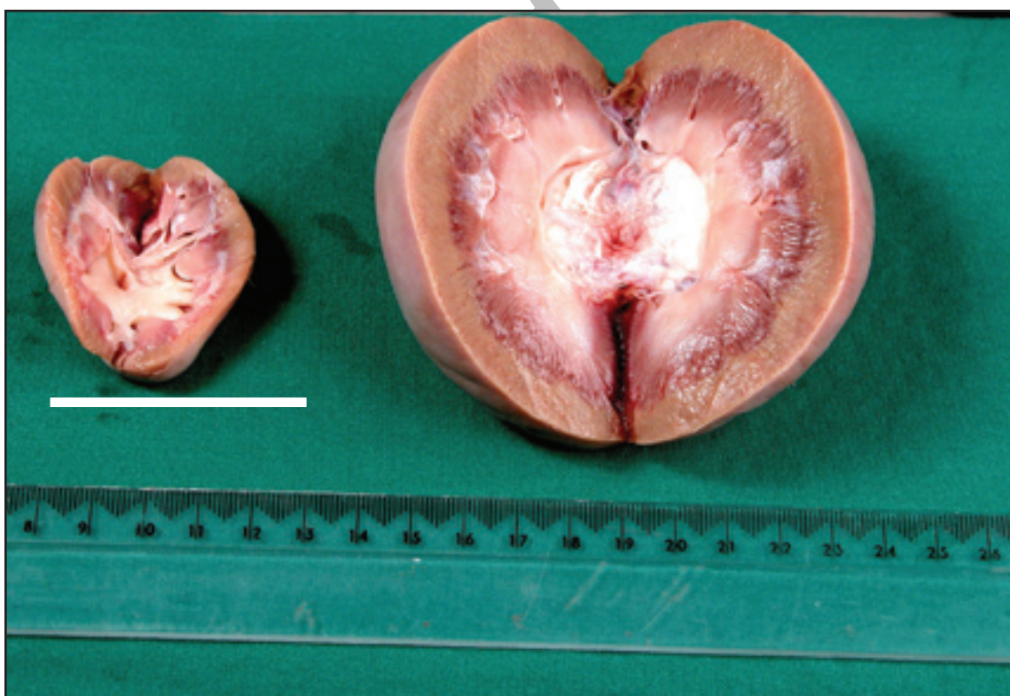
شکل ۱- کلیه دیسپلاستیک در سمت چپ و کلیه هیپرتروفیک در سمت راست مشاهده می‌شود.

نتایج مطالعات میکروسکوپی شامل حضور بافت فیروزه فراوان، لوله‌ها و گلومرول‌های اولیه تکامل نیافته حاکی از دیسپلاستیک شدن کلیه کوچکتر بود، یافته‌های میکروسکوپی دال بر فقدان کیست‌های کلیوی و بافت‌های غیر طبیعی همچون غضروف بود (شکل ۲). در حالی که کلیه دیگر به لحاظ ماکروسکوپی دچار هیپرتروفی جبرانی