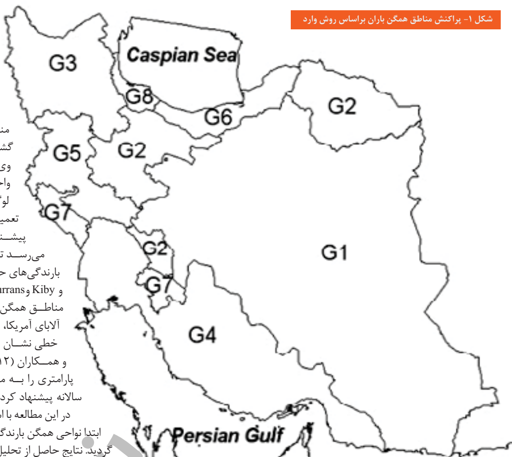
شکل ۱- پراکنش مناطق همگن باران براساس روش وارد

قابل قبول نیستند. برای تمام ایستگاه‌ها در کل کشور، تنها تابع لوگ نرمال ۳ پارامتری به عنوان تابع ناحیه‌ای قابل قبول است.