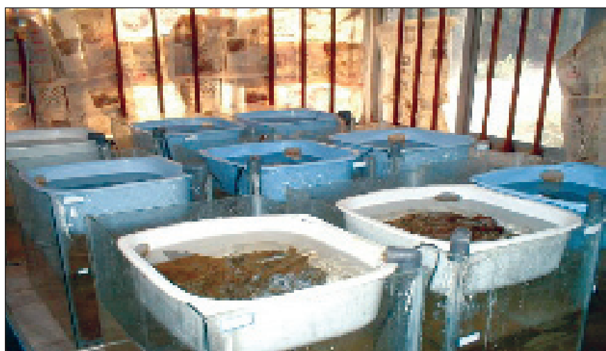
شکل ۱- نمای کلی طرح آزمایش و قرار گیری واحدهای آزمایش در آن.

همانطور که جدول ۲ نشان می دهد، درصد پروتئین وزن خشک برگ‌های چنار و توسکا اختلاف معنی داری را نشان داد ( p < 0.05 ). این میزان در برگ خشک توسکا بیشتر از برگ چنار بود. اختلاف معنی داری بین درصد مجموع سلولز و لگنین برگ‌های چنار و توسکا وجود