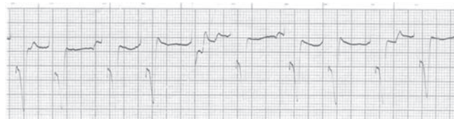
شکل ۲: اسب، برادری کاردی و ریتم فرار بطنی، الکتروکاردیوگرام اخذ شده در اشتقاق قاعده ای راسی با سرعت ۲۵ میلیمتر بر ثانیه در روز دوم.