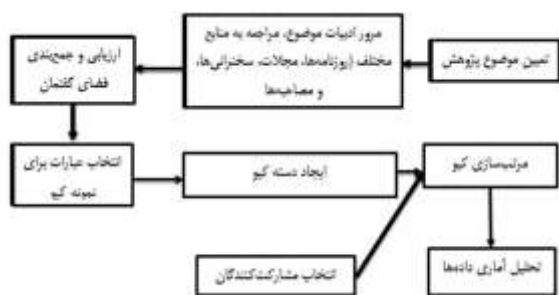
شکل ۱. گام‌های فرایند اجرای تحقیق با روش کیو [۱۴]

استفاده از ترکیب دو مجموعه تحقیق کمی و کیفی به انجام می‌رسند و شواهد بیشتری برای درک بهتر پدیده‌ها به دست می‌دهند و محدودیت طرح‌های تحقیق کمی و تحقیق کیفی را از میان بر می‌دارند [۱۲]. روش استفاده شده در این پژوهش روش کیو است که به عنوان یک روش ترکیبی یا آمیخته شناخته می‌شود. در واقع روش کیو یک بسته روش‌شناسی کامل است که به ترتیب مراحل مطالعه کیفی و مطالعه کمی را در بر می‌گیرد [۱۴-۱۳]. روش کیو، روش تحقیقی است که برای رتبه بندی گویه‌های بررسی شده (عبارت، جمله، عکس، خبر و...) با استفاده از مقیاسی شبیه مقیاس لیکرت به کار می‌رود و همبستگی بین پاسخ‌های افراد مختلف به این رتبه‌بندی معطوف می‌شود. در این روش گویه‌های بررسی شده روی کارت‌هایی که به کارت‌های کیو موسوم هستند، نوشته یا چاپ می‌شوند و در اختیار پاسخگویان قرار می‌گیرند و به ترتیبی که پژوهشگر تعیین می‌کند، روی کارت‌های مقیاس لیکرت توزیع می‌شوند، به صورتیکه توزیع فراوانی‌ها «شبه نرمال» باشد؛ بنابراین روش کیو یک روش تحقیق مورد استفاده برای مطالعه ذهنیت افراد است و در این مورد که «چگونه افراد در مورد یک مقوله فکر میکنند» مورد استفاده قرار گرفته است. شناسایی روش‌شناسی کیو برخلاف روش‌های کمی معمول که در آن‌ها تعداد اندکی سؤال از تعداد زیادی پاسخگو پرسیده می‌شود، در مطالعه کیو، تعداد زیادی سؤال از تعداد کمی پاسخگو پرسیده می‌شود. این مطالعه تنها در پی آن است که الگوهای ذهنی مختلف را کشف کند و برای کشف یک الگو وجود تنها یک فرد با آن الگوی خاص کافی است. مراحل و گام‌های مختلف این روش در شکل (۱) ترسیم شده است: