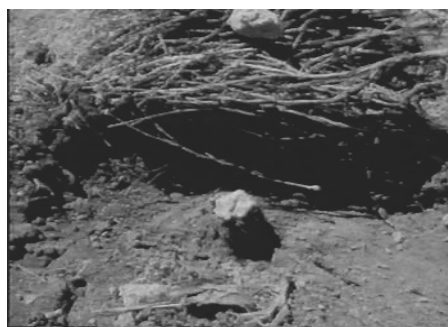
شکل ۲- مرحله گول گذاری

برش‌های عرضی از قسمت بالا (از محل اتصال برگ‌ها به ساقه) به طرف پایین می‌شود، ضخامت هر قطعه برش بستگی به مهارت کارگر ۴-۲ میلی‌متر است. در فاصله بین