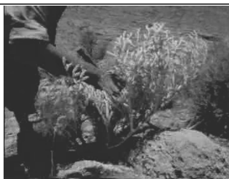
شکل ۱- مرحله نشانه گذاری بوته ها

به طوری که چاله‌ای در اطراف بوته به عمق ۲۰-۱۵ سانتی‌متر ایجاد می‌شود. پس از خارج ساختن خاک، الیاف روی ساقه را برداشته، بخش باقیمانده را به منظور حفاظت ساقه از خشکی و آسیب‌های دیگر می‌پوشانند. سپس اطراف بوته را با سنگ یا کلوخ (سه عدد سنگ) سایه می‌اندازند تا از آفتاب مصون بماند و در اثر گرما فاسد نشود (شکل ۲).