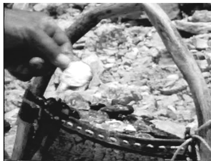
شکل ۳- مرحله برداشت و تیغ‌زنی

به‌منظور افزایش سطح رویشگاه‌ها و احیای مناطق آنگوزه‌خیز، منطقه عملیات کپه‌کاری در نظر گرفته می‌شود. بدین منظور هر ساله در هر رویشگاه سطحی به وسعت ۱۰۰ هکتار و در مجموع ۲۷۰۰ هکتار در قطعات پیش‌بینی شده اقدام به کپه‌کاری بذر آنگوزه می‌شود. بدین صورت که به‌فواصل ۳×۳ متر به تعداد تقریبی ۱۲۰۰ کپه در هر هکتار چاله‌هایی به ابعاد ۱۰×۱۰×۱۵ سانتی‌متر حفر و تعداد ۳-۵ عدد بذر بوجاری شده کشت و روی بذر با لایه‌ای از خاک به ضخامت ۱-۲ سانتی‌متر پوشانیده می‌شود.