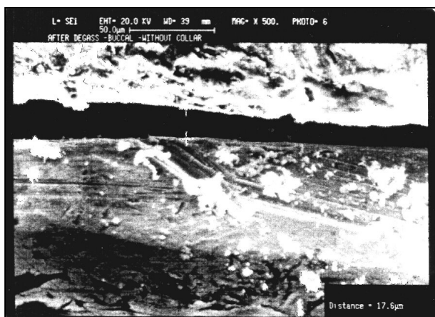
تصویر شماره ۲- تصاویر میکروسکوپ الکترونی سطح باکال نمونه‌های بدون کلار با بزرگنمایی ۵۰۰ برابر در مرحله بعد از دگاز