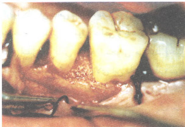
تصویر شماره ۳- گذاشتن ماده پیوندی در داخل ضایعه