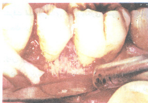
تصویر شماره ۴- باز کردن، ترمیم و بررسی ناحیه پس از ۶ ماه