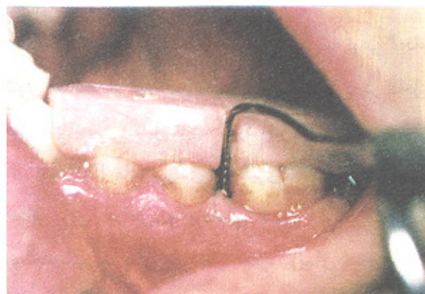
تصویر شماره ۱- عمق پاکت (M|6) قبل از عمل در بیمار گروه آزمایش

جلسات مراجعه بیماران به طور منظم ماهی یک‌بار انجام شد و ۶ ماه پس از جراحی اول جراحی Re-Entry انجام گرفت. پس از انجام فلپ موکوپریوستال در ناحیه مورد نظر، مجدداً اندازه‌گیریهای نسج سخت تکرار شد (تصویرهای شماره ۱ تا ۴).