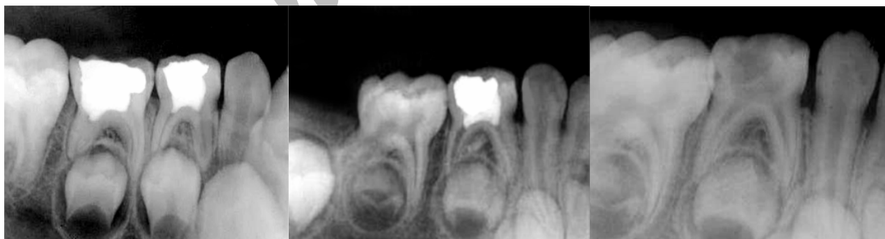
الف شکل ۳ الف- رادیوگرافی درمان به روش MTA: موفقیت درمان عکس اولیه ب- رادیوگرافی درمان به روش MTA: موفقیت درمان پیگیری سه ماهه ج- رادیوگرافی پالپوتومی موفقیت MTA پس از شش ماه