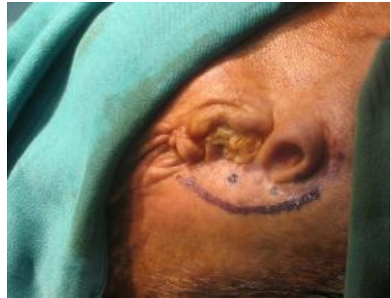
شکل ۸- نواحی علامتگذاری شده با متیلن بلو بر روی پوست

پروتزهای جایگزین گوش می‌توانند نتایج زیبایی خوبی به همراه داشته باشند. متأسفانه استفاده از مواد آدهزیو به دلیل وجود مو و فقدان ناهمواری آناتومیک، نتیجه مطلوبی نمی‌دهد. استفاده از ایمپلنت‌های ماگزیلوفیشیال، در بازسازی ضایعات خارج دهانی می‌تواند نقش مهمی در بالا بردن سطح کیفیت زندگی بیماران داشته باشد. با توجه به محدودیت کمی و کیفی استخوان در ناحیه ضایعه، باید طرح درمان مناسبی برای بیماران، بر اساس استنت دقیق رادیوگرافی و جراحی در نظر گرفته شود. دقیق بودن استنت، تثبیت موقعیت آن بر اساس نواحی آناتومیک ثابت و غیر متحرک است. بر اساس مطالعات انجام شده توسط محققین مختلف (۵-۸) نتایج درمان پروتزهای گوش متکی بر ایمپلنت کاملاً رضایت بخش بوده است. در مطالعه انجام شده توسط Roumanas و همکاران در سال ۲۰۰۲ (۹) در طی یک دوره ۱۴ ساله، بیشترین میزان موفقیت ایمپلنت‌های ماگزیلوفیشیال مربوط به ناحیه گوش، ۹۵٪ بود. پروتزهای گوش متکی بر ایمپلنت در صورتی که طرح درمان بر اساس استنت رادیوگرافی و جراحی انجام شده باشد، از نظر زیبایی قابل پیش بینی خواهد بود. چرا که اگر موقعیت ایمپلنت با کانتور ظاهری گوش مغایرت داشته باشد، موقعیت باروکلپس در خارج از ناحیه آناتومیک خواهد بود و بیمار با مشکل زیبایی مواجه خواهد شد.