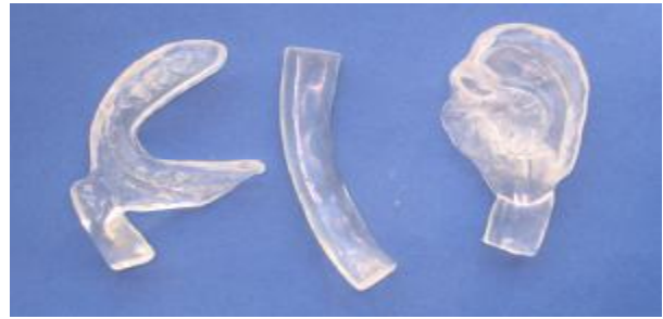
شکل ۲ - گوش آکریلی سمت چپ، بار آکریلی و رکورد اکلوژی آکریلی