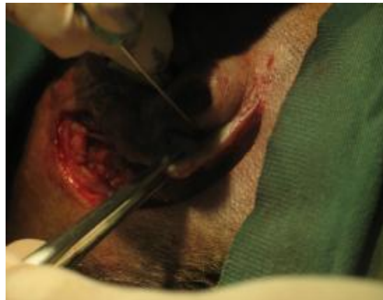
شکل ۹- انتقال نواحی مورد نظر به کمک سوزن بر روی استخوان