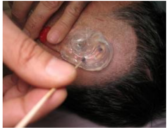
شکل ۷- استفاده از استنت حین جراحی