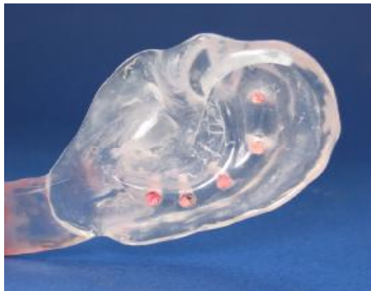
شکل ۵- ایجاد ۵ عدد سوراخ در ناحیه آنتی هلیکس استنت