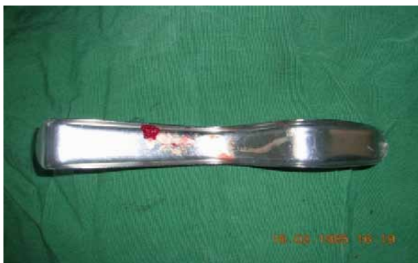
د- استفاده از A.B.G در سمت کنترل