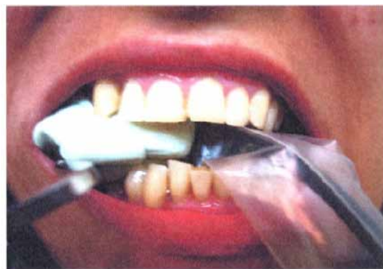
ج) Template و Sensor با XCP در دهان بیمار

در ضایعات گروه کنترل در این مرحله به جای Cerasorb از Autogenous Bone Graft استفاده شد، به این ترتیب که پس از تمیز کردن ضایعه و آماده‌سازی محل، جراحی اضافه برای برداشتن Autogenous Bone در ناحیه توبروزیته یا رترومولر انجام گرفت و استخوان به صورت مخلوط اسفنجی و کورتیکال تهیه گردید (شکل ۲).