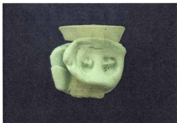
شکل ۱- تهیه رادیوگرافی RVG الف) Template تهیه شده از ماده قالب‌گیری