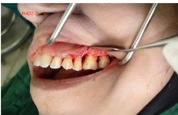
ب) بلند کردن فلپ موکوپریوستال