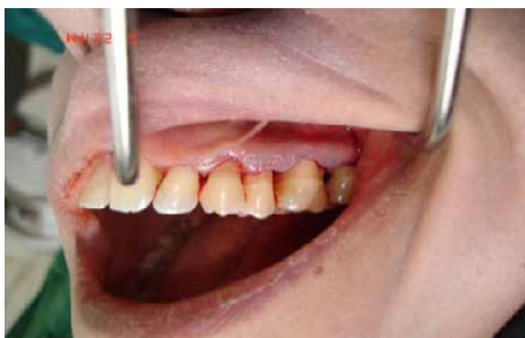
شکل ۲ - مراحل جراحی الف) برش سالکولار در سمت باکال