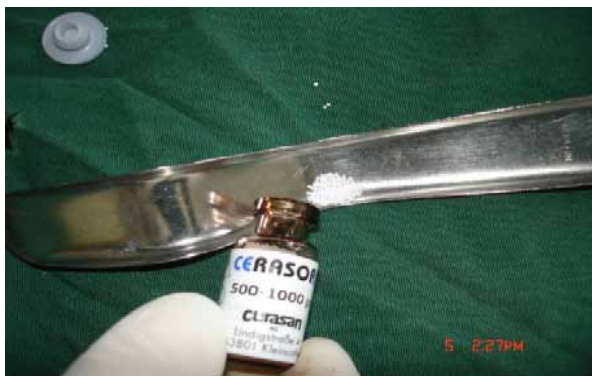
ج- استفاده از Cerasorb در سمت تست