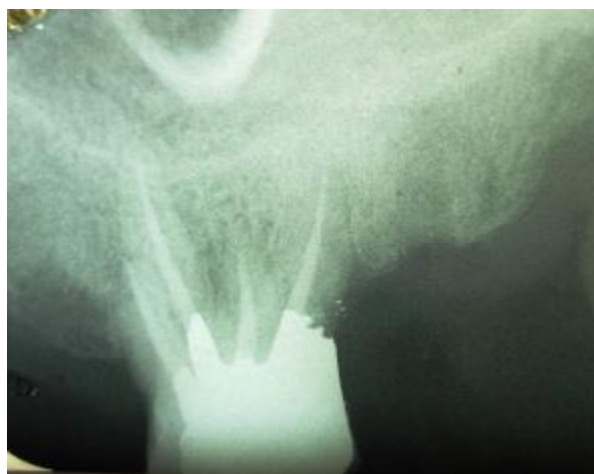
شکل 4- Recall بعد از گذشت 9 ماه از درمان کانال ریشه، بدون هیچگونه علایم و ضایعه پری اپیکال به همراه ترمیم آمالگام

در ارزیابی رادیوگرافیکی که پس از 9 ماه به عمل آمد، بافت پری اپیکال نرمال بود و دندان مورد نظر از نظر کلینیکی فاقد علایم مشاهده گردید (شکل 4).