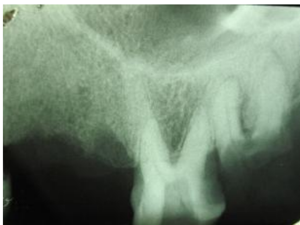
شکل 1- رادیوگرافی پیش از درمان، رادیولونسیس پری اپیکال را نشان نداد.

کامل برخوردار بود. در ارزیابی اولیه رادیوگرافیک، تصویر دندان مورد نظر با آناتومی موارد متعارف همخوانی نداشت (شکل 1).