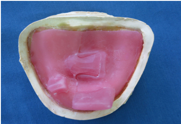
شکل ۳- تری VLC

۸- از آنجایی که در مرحله قبل ثبات قالب ایده‌آل نبود؛ بنابراین جهت دقت بیشتر یک تری VLC دیگر به نحوی طراحی و ساخته شد که قطعات راست و چپ به وسیله یک ناحیه قفل شونده به هم متصل شوند و قسمت کوچک‌تر در سمت چپ که دارای وستیبول عمیق تری بود طراحی شد (شکل ۳).