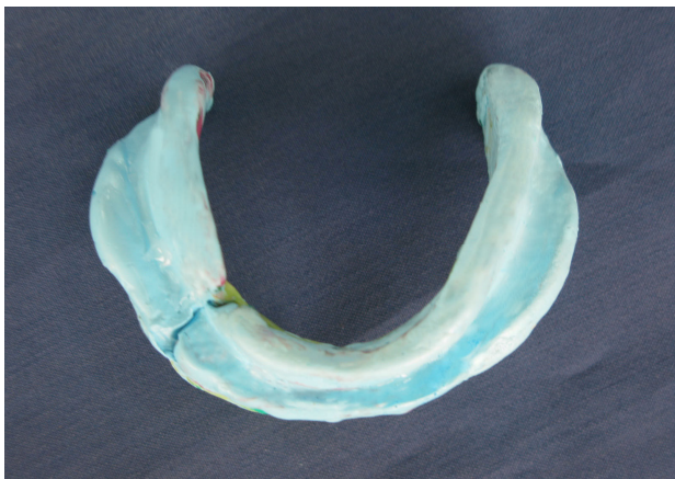
شکل ۴- اتصال دو قسمت قالب

گردید (شکل ۴) و کست به وسیله گچ دندانپزشکی ریخته شد. از آنجایی که بیس به دست آمده حجم کوچک‌تری از تری داشت، با مانور خاصی امکان داخل بردن بیس در دهان به صورت یک تکه حاصل شد و در نهایت مراحل ساخت دنچر به صورت معمول انجام گردید. از آرایش مونوپلن جهت چیندن دندان‌ها استفاده شد، دنچر تحویل داده شد و جلسات پیگیری حمایت و تنظیم صورت گرفت و پس از ۲ سال پیگیری بیمار از دنچر انجام گردید.