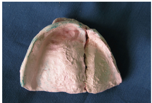
شکل ۲- کست با گچ دندانپزشکی

۷- بوردرها تنظیم شده و قالب به وسیله خمیر زینک اکساید ازنول (Kerr Italia, Ealerno, Italy) وقتی که دو قسمت در دهان به هم متصل شده بودند گرفته شد. زمانی که ماده Set شد، قالب به صورت ۲ قسمت جدا از هم از دهان خارج شده و اضافات از لبه‌های تری به وسیله تیغ بیستوری برداشته شد، سپس دو قسمت به هم متصل گشت و کست با گچ دندانپزشکی ریخته شد (شکل ۲).