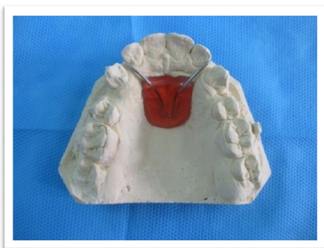
شکل ۱- پلاک رفرنس

کست‌های تهیه شده در ابتدای Retraction و ۴ و ۸ هفته بعد، تریم شدند و پاپیلای انسیزیو و رافه میانی کام بر روی آنها مشخص گردید. بر روی کست اولیه هر بیمار پلاک آکریلی در ناحیه روگا به نحوی ساخته شد که فقط قسمت مرکزی روگای پالاتال را بپوشاند و سیم‌های رفرنس بر روی کست با سیم ۰/۹ میلی‌متر داخل پلاک آکریلی قرار گرفتند (شکل ۱).