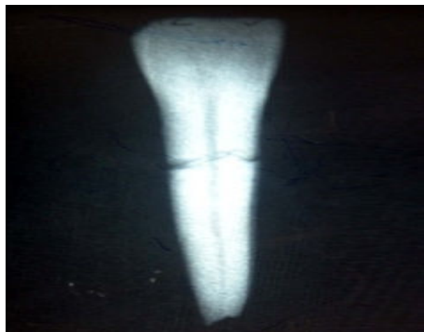
شکل ۱- نمای رادیوگرافیک نمونه شماره ۱ در حالت دندان به تنهایی

دندان‌ها شماره‌گذاری شد و از هر دندان دو رادیوگرافی به عمل آمد. رادیوگرافی اول فقط از دندان و با زاویه عمود بر محور طولی دندان و زمان اکسپوژر ۰/۱۲ ثانیه و رادیوگرافی دوم درحالی‌که زاویه دندان و تیوپ رادیوگرافی ثابت بود با اضافه کردن قطعه‌ای از استخوان مندیبل انسان به ضخامت ۲/۵ سانتی‌متر، با همان زاویه قبلی و با زمان اکسپوژر ۰/۱۶ ثانیه به عمل آمد. بدین ترتیب برای هر دندان، زاویه تیوپ اشعه و دندان ثابت و تنها تفاوت، در اضافه شدن استخوان مندیبل و تغییر متناسی در میزان اشعه ایکس بود. بنابراین دو دسته رادیوگرافی به دست آمد، دسته اول رادیوگرافی‌هایی بودند که از "دندان به تنهایی" و دسته دوم رادیوگرافی‌هایی بودند که از "دندان به همراه استخوان" به عمل آمده بود (اشکال ۱ و ۲).