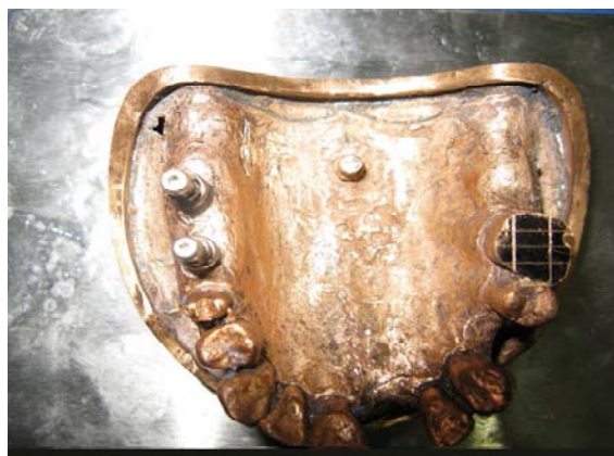
شکل 1- کست مرجع تهیه شده

یک رفرنس فلزی به عنوان مرجع اندازه‌گیری وجود داشت. با هیدروکلونید غیرقابل برگشت (Alginoplast; Heraeus Kulzer, Hanau, Germany) از مدل درحالی که ترانسفر کویپینگ‌های مربوط به قالب‌گیری تری بسته بر روی آن بسته شده بود قالب تهیه شد. بدین ترتیب کستی ساخته شد که تری اختصاصی از آن به دست آمد. برای ساخت تری اختصاصی جهت قالب‌گیری از دندان به تنهایی، بدون وجود کویپینگ‌ها قالب‌گیری انجام شده و تری اختصاصی ساخته شد. کست‌ها با دو لایه موم بیس پلیت (Modelling Wax; Dentsply, Weybridge, UK) پوشانده شد تا ضخامت کافی ماده قالب‌گیری پلی‌اتر فراهم گردد و به علاوه 3 استاپ بافتی در آن تعبیه شد تا موقعیت قرارگیری تری در هنگام تهیه قالب و نیز ضخامت ماده قالب‌گیری استاندارد باشد. با استفاده از نرم‌افزار Mini tab حجم نمونه 9 عدد در هر گروه برای مطالعه حاضر تعیین گردید.