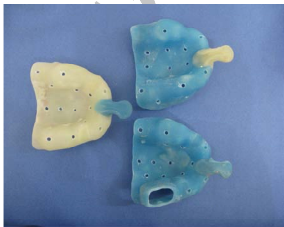
شکل 2- تری‌های اختصاصی به صورت تری باز و تری بسته تهیه شده

بین مطالعاتی که در مورد تکنیک قالب‌گیری بررسی کرده‌اند، Carr (1991) دو تکنیک مستقیم و غیرمستقیم را روی 5 مدل ایمپلنت مورد بررسی قرار داد و نتیجه گرفت که در روش مستقیم (Direct transfer) دقت بسیار بیشتری روی کست نهایی به دست می‌آید (8). در سال 2001 Daoudi و همکاران دقت 4 روش قالب‌گیری را با استفاده از 2 ماده قالب‌گیری متفاوت مطالعه کردند (15). نتایج تفاوت‌های زیادی را در مقایسه تکنیک قالب‌گیری Repositioning با تکنیک Pick up نشان دادند. در سال 2008 Lee و همکاران (16) در یک مطالعه مروری که با هدف بررسی دقت تکنیک‌های مختلف قالب‌گیری و نیز فاکتورهای مؤثر در دقت قالب‌گیری از ایمپلنت انجام شد، نتایجی به شرح ذیل ارائه کردند: از میان حدود 14 مطالعه که دقت قالب‌گیری به روش Pick و Transfer up را بررسی کرده بودند 5 مطالعه 3 یا تعداد کمتری ایمپلنت را مورد استفاده قرار داده بودند؛ 4 مطالعه تفاوتی بین تکنیک Transfer و Pick up پیدا نکردند؛ 9 مطالعه مقایسه این دو تکنیک را وقتی که 4 یا تعداد بیشتری ایمپلنت مورد استفاده قرار گرفته بودند بررسی کردند که 5 تا از آنها دقت بیشتری را در تکنیک Pick up و یکی در تکنیک Transfer نشان دادند و 3 مطالعه تفاوتی بین دو تکنیک نشان ندادند. هدف از انجام این مطالعه، بررسی دقت ابعادی و زاویه‌ای دو تکنیک قالب‌گیری تری باز و تری بسته و دقت ثبت جزئیات سطحی با استفاده از ماده قالب‌گیری پلی‌اتر بود.