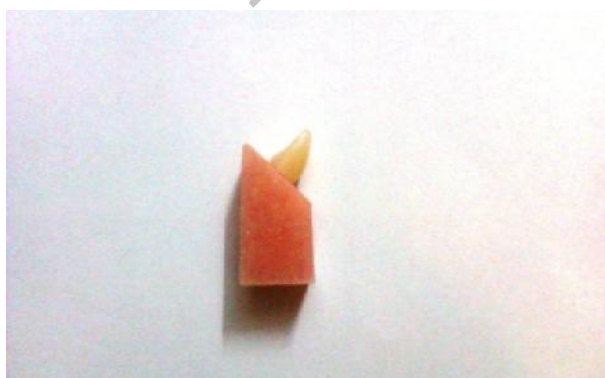
شکل ۲- نمونه آماده شده

شبه‌سازی محیط دهانی با انجام ترموسایکلینگ (ایجاد حرارت و رطوبت مشابه محیط دهان) و Cyclic loading (اعمال نیروهای جویدن) انجام نشده است که ما در تحقیق حاضر مدنظر قرار داده‌ایم (۱۷). با توجه به کاستی‌های فوق و اظهارات کارخانه‌های سازنده دندان مصنوعی کامپوزیتی مینی بر بیشتر بودن زیبایی این دندان‌ها و قابل مقایسه بودن سایش آنها با دندان‌های آکریلی، این تحقیق با هدف مقایسه تأثیر ۴ نوع دندان مصنوعی (دندان‌های کامپوزیتی (مولتی‌لیتیک) و آکریلی (مونولیتیک) Ideal makoo و Ivoclar) با و بدون Cyclic loading بر میزان استحکام باند در آکریل بیس دنچر خودبه‌خود پلیمریزه شونده در بخش پروتز متحرک دانشکده دندانپزشکی دانشگاه آزاد اسلامی طراحی و اجرا شد. با امید به این که نتایج این تحقیق در انتخاب نوع دندان و آکریل بیس مفید واقع شود.