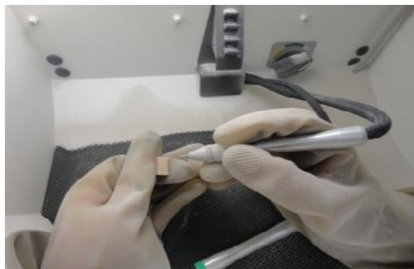
شکل ۲- عمل سنبلاست