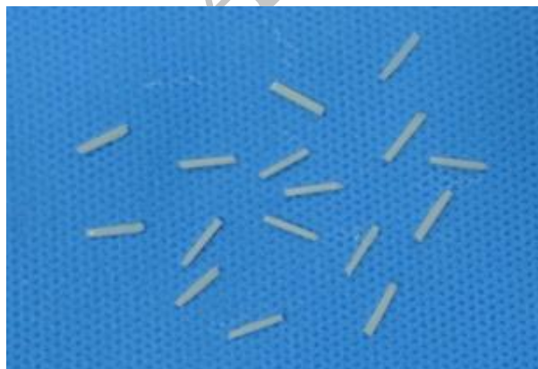
شکل ۳- نمای نمونه‌ها پس از برش

شد طبق دستور کارخانه سازنده به مدت ۱۰ ثانیه در دستگاه کیور LightStep SLI, GC Gradia شد. ۳۶ بلوک تهیه شده و به صورت تصادفی در ۱۲ گروه قرار گرفت: