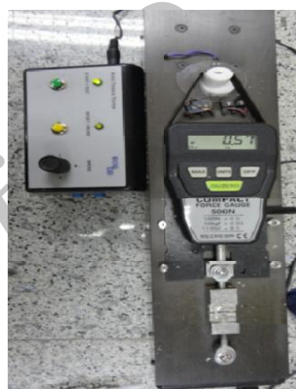
شکل ۴- دستگاه سنجش استحکام باند

در مطالعه پیش‌رو، مثل مطالعه Vanini و D'Arcangelo (۲۰۰۷)، در بررسی اثر آماده‌سازی‌های سطحی مختلف بر خصوصیات آدهزیو کامپوزیت‌های غیرمستقیم، از ذرات آلومینوم اکساید