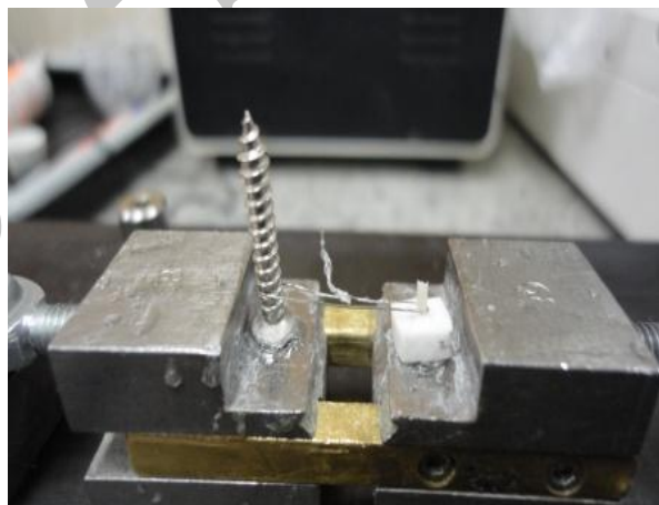
شکل ۴- حلقه در یک سو در دور استوانه کامپوزیتی قرار داده شد به نحوی که تقریباً با نیمی از محیط استوانه در تماس باشد

بین دو حمام آب 50^\circ و 55^\circ درجه سانتی‌گراد حرکت کردند، فاصله بین دو حمام ۱۵ ثانیه و مدت زمانی که در هر حمام قرار می‌گرفتند ۳۰ ثانیه بود. سپس نمونه‌ها جهت انجام تست ریزبرشی به دستگاه (EZ-Test-500N, Shimadzu, Universal testing machine (Kyoto, Japan) با استفاده از چسب سیانو آکریلات (Zapti, Dental Ventures of America, Corona, CA, USA) متصل شدند. باند برشی در این مطالعه به روش Wire and Loop اندازه‌گیری شده است. Loop با استفاده از سیم ارتودنسی به قطر 0.2 \text{ mm} میلی‌متر تهیه شد. این حلقه در یک سو در دور استوانه کامپوزیتی قرار داده شد به نحوی که تقریباً با نیمی از محیط استوانه در تماس باشد، در طرف مقابل، سیم در دور میله‌هایی قرار داده شده که به همین منظور تعبیه شده بودند. اتصال بین استوانه، سیم و میله‌ها طوری انجام شد که خط واصل بین این سه جزء تست در یک راستا قرار گیرد (شکل ۴).