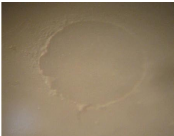
شکل ۵- بررسی نحوه شکست با استفاده از استریومیکروسکوپ

در این حالت اطمینان بیشتری از توزیع بار برشی در ناحیه اینترفاسیال وجود داشت، قبل از آغاز Load نیرو دقت شد که حلقه سیمی تا حد امکان نزدیک به ناحیه اینترفاسیال باشد. سپس نمونه‌ها در معرض نیروی برشی با سرعت 0.5 \text{ mm/min} قرار گرفتند تا شکست اتفاق بیفتد. نیروی اعمال شده بر نمونه برحسب نیوتن از روی مانیتور دستگاه یادداشت شد و از تقسیم این نیرو بر سطح مقطع استوانه کامپوزیتی (برابر با مساحت سطح اتصال) استحکام باند ریزبرشی برحسب مگاپاسکال به دست آمد. با توجه به مستقل بودن دو متغیر سرامیک زیرکونیایی و نوع سمان مصرفی و وابسته بودن متغیر استحکام باند ریزبرشی از روش Two-way ANOVA برای تحلیل و آنالیز داده‌ها استفاده شد. در مرحله بعد نمونه‌ها برای تعیین نحوه شکست با استفاده از استریومیکروسکوپ تحت بررسی قرار گرفتند (شکل ۵).