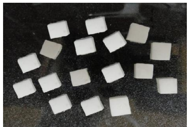
شکل ۱- بلوک‌های پیش‌ساخته سینتر شده از دو نوع کور زیرکونیای سفید رنگ

بلوک‌های پیش‌ساخته سینتر شده از دو نوع کور زیرکونیای سفید رنگ (Cercon و Zirkozahn (Gais, Bruneck, Italy) به ابعاد 3 \times 7 \times 7 \text{ mm}^3 در رزین پلی‌استرمانت گردید. سپس این بلوک‌ها توسط دستگاه Low speed diamond saw (لیه برنده تیغه از جنس الماس و ضخامت آن 0.5 میلی‌متر بود) برش خوردند (شکل ۱). با انجام برش تعداد ۲۴ نمونه از هر دو نوع کور زیرکونیایی با ابعاد 3 \times 7 \times 7 \text{ mm}^3 تهیه شد. نمونه‌ها توسط ذرات \text{Al}_2\text{O}_3 با قطر 50 \mu\text{m} و فشار ۳ بار در فاصله ۱۰ میلی‌متر به مدت زمان ۱۰ ثانیه سنبلاست شدند، سپس نمونه‌ها به مدت ۲ دقیقه در دستگاه اولتراسونیک حاوی اتانول ۹۶٪ قرار گرفتند تا آلودگی سطحی آن‌ها حذف گردد. نمونه‌ها به ۴ گروه ۱۲ تایی تقسیم شدند، به گونه‌ای که دو گروه ۱۲ تایی Cercon و دو گروه ۱۲ تایی Zirkozahn داشتیم. لوله‌های پلاستیکی شفاف با قطر داخلی ۱ میلی‌متر و ارتفاع ۳ میلی‌متر که توسط کامپوزیت Flow رنگ (3M ESPE, Germany) پر شده بود، توسط دستگاه لایت (Bluephase 16i, Ivoclar Vivadent, Austria) با شدت (500 \text{ mW/cm}^2) در دو مرحله ۴۰ ثانیه‌ای از دو سمت مقابل هم کیور شد و استوانه‌های کامپوزیتی با استفاده از تیغ بیستوری از داخل لوله‌های پلاستیکی خارج شدند (شکل ۲).