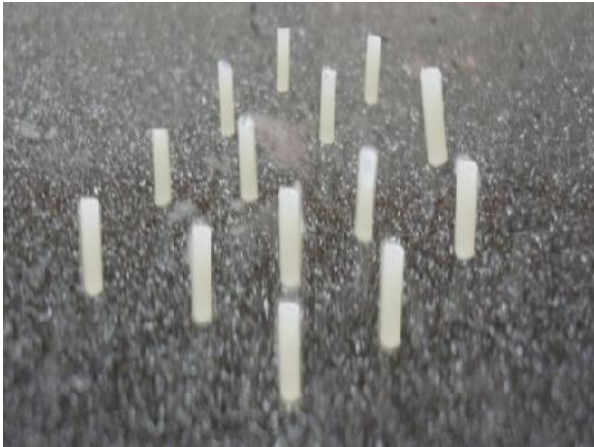
شکل ۲- استوانه‌های کامپوزیتی