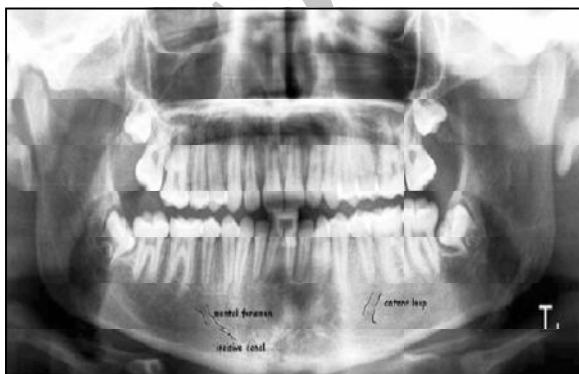
شکل ۱- رادیوگرافی پانورامیک (چپ) و پانورامیک بازسازی شده از CBCT (راست) نشان دهنده محل انشعاب کانال ثنایایی از کانال مندیبولار می‌باشد.

کانال مندیبولار یکی از ساختارهای آناتومیک نرمال فک تحتانی مرتبط با درمان ایمپلنت است که از سوراخ مندیبولار در راموس به صورت مورب به طرف پایین و قدام آمده و سپس در تنه مندیبل به صورت افقی پیش می‌رود. عمدتاً مابین ریشه‌های پرمولر اول و دوم و یا زیر پرمولردوم پایین، این کانال به دو قسمت چانه‌ای و ثنایایی تقسیم می‌شود که شاخه چانه‌ای با یک چرخش به سمت بالا و دیستال به نام حلقه قدامی از محل سوراخ چانه‌ای در سطح باکال مندیبل خارج می‌شود و شاخه ثنایایی نیز از داخل کانال ثنایایی زیر ریشه دندان‌های ثنایای پایین تا محل سوراخ زبانی امتداد می‌یابد (۱،۲) (شکل ۱).