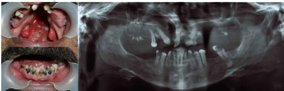
شکل ۱- فوتوگرافی و رادیوگرافی بیمار در مراجعه اولیه و پیش از آغاز درمان

درمان انتخابی در این بیمار پیوند استخوان و استفاده از پروتز متکی بر ایمپلنت بود که با توجه به اندازه ضایعه، سن و خواست بیمار و