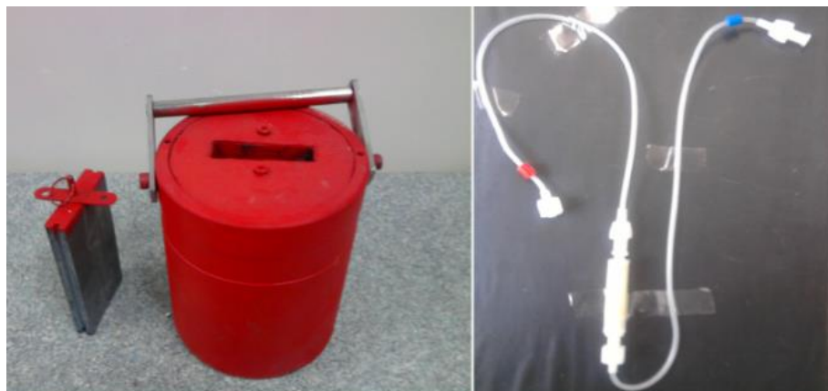
شکل ۴- ژنراتور نوع دوم روی-۶۲ / مس-۶۲.

نظری و عملی رادیو نوکلیدهای ارایه شده در جدول ۱ می باشد. این دسته از ناخالصی‌ها در فرایند شیمی به طور کامل حذف می شوند زیرا ستون تبادل یونی تنها رادیونوکلیدهای روی را جذب می نماید و سایر عنصرها از روی ستون عبور نموده و در پسماند جمع آوری می شوند. ناخالصی عمده غیر رادیو اکتیو که شامل مس طبیعی هدف و طلای آبکاری است نیز به روش بالا توسط ستون کروماتوگرافی حذف و وارد پسماند می شود. برای اطمینان از این حذف برای دسته اول اندازه گیری رادیواکتیو بر اساس بازبینی طیف گامای مقدارهای اندکی از محلول رادیواکتیو تولیدشده، با استفاده از آشکارساز بسیار خالص ژرمانیم صورت گرفت و تولید روی - ۶۲ و پس از آن مس - ۶۲ با خلوص بالای ۹۹/۹۸٪ تأیید شد (رادیوگرام (۲و۱). برای اندازه گیری ناخالصی‌های غیر رادیو اکتیو