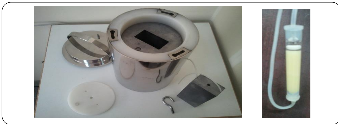
شکل ۵ - ژنراتور نوع سوم روی - ۶۲ / مس - ۶۲ با نام تجاری ParsCuGen.

که از رادیو ایزوتوپ روی - ۶۲ با نیمه عمر ۹۶ ساعت تولید می‌شود، ژنراتور قابل حمل باید در سطوح بالایی از فعالیت رادیو کتیو تولید شود [۱۳]. ۵۰۰۰ میلی کوری از رادیو ایزوتوپ روی - ۶۲ تولید شده بر روی رزین ژنراتور نوع سوم بارگذاری شد. با استفاده از رزین‌های تبادل یونی، ژنراتور می‌تواند محلول مس - ۶۲ را با خلوص ۹۹/۹۹٪ با کم‌ترین نشت روی - ۶۲ (به تقریب صفر) در مقیاس بالا تولید نماید و قدرت انتخاب ایزوتوپی را بین ایزوتوپ مادر و دختر به پژوهشگر ارایه می‌نماید. در پروژه پژوهشی هماهنگ آژانس بین المللی انرژی اتمی تمامی آزمایش‌ها برای تولید این ژنراتور با هدف‌های ورقه‌ای نازک (۱) با جریان بمباران پایین انجام شدند و در نتیجه دارای فعالیت ویژه تولیدی پایین و متوسط گزارش شده است. این کار بر ارزیابی تولید رادیو ایزوتوپ روی - ۶۲ با بازده بالا و ساخت هدف جدید بر اساس لایه نشانی مس طبیعی بر روی سطح طلای بسیار خالص و جداسازی