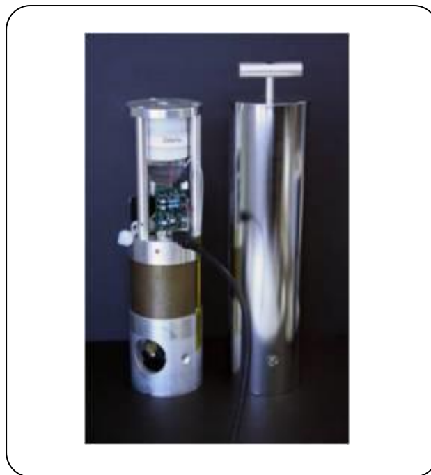
شکل ۱- ژنراتور و دستگاه دوشش روی-۶۲/مس-۶۲ [۳].

همان‌گونه که در شکل ۲ نشان داده شده است، یک لایه مس آبکاری شده بر روی سطح پوشیده از طلا با یک زاویه ۶ درجه نسبت به پرتوهای پروتونی تابش‌دهی می‌شود. این هدف با استفاده از جریان آب با سرعت جریان ۵۰ L/min تا دمای ۱۸ درجه سلسیوس خنک شد. به منظور تهیه لایه محافظ طلا، یک حمام طلا (دارای \text{HAuCl}_4 به عنوان منبع طلا) مورد استفاده قرار گرفت و لایه نشانی طلا بر طبق روش گزارش شده پیشین با تغییر جزئی انجام شد [۱۲]. لایه نشانی مس طبیعی بر روی لایه آبکاری شده طلا با شرایط بهینه به صورت زیر انجام گرفت. حمام آبکاری: مس سیانید: ۶/۵ گرم، پتاسیم سیانید: ۱۱/۵ گرم، سدیم کربنات: ۵/۵ گرم و سدیم هیدروکسید: ۱/۵ گرم. جریان: ۳/۵ آمپر بر دسیمتر مربع. زمان: ۶ ساعت، سرعت همزدن: ۸۰۰ rpm حجم کلی: ۵۰۰ میلی لیتر. دما: ۷۰-۶۰ درجه سلسیوس. ضخامت مس آبکاری شده به وسیله کم کردن وزن هدف پیش و پس از فرایند لایه نشانی تعیین شد. ضخامت بعد از ۴ ساعت، به میزان ۱۹۰ میکرومتر اندازه گیری شد.