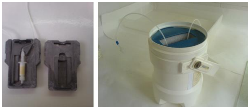
شکل ۳- ژنراتور نوع اول روی-۶۲ / مس-۶۲.