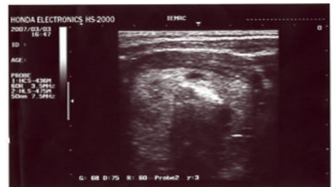
تصویر ۳- نکروز کواگولاتیو در اثر لیزر