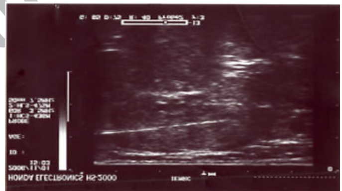
تصویر ۲- مشاهده‌ی سونوگرافی ورود سوزن نخاعی در مرکز گره