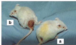
شکل ۱- مقایسه موش درمان شده (a) با موش گروه کنترل (b)

نتیجه درمان در گروه تیمار شده با اسانس ۱۰٪ اوکالیپتوس: ۸ عدد موش زخمی موجود در این گروه با اسانس ۱۰٪ اوکالیپتوس درمان شدند. بعد از یک دوره درمان ۳۵ روزه نتیجه از این قرار بود: زخم‌های کوچک و چرکی نشده بعد از دو هفته درمان کاملاً بهبود یافتند و آزمون پارازیتولوژی آنها نیز منفی بود. قطر زخم‌های بزرگ و چرکی شده ثابت باقی ماند و افزایش نیافت (شکل ۱) و تعداد انگل‌های موجود در آنها نیز کاهش یافته بود. لازم به ذکر است که در یکی از موش‌ها قطر زخم افزایش یافت (جدول ۱ و ۲).