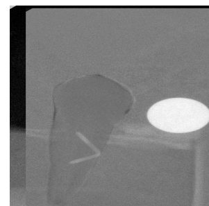
شکل ۲: نمای کره فلزی بر روی رادیوگرافی تفریقی برای برآورد عامل بزرگنمایی

عمق ناحیه معدنی زدایی شده با برنامه Vix Win 2000 (V1.9 Dentsply Gendex) در روز ۴۲ بعد از برآورد عامل بزرگنمایی برای هر تصویر (M = \frac{\text{قطر کره روی تصویر}}{\text{قطر واقعی کره}}) (۹) تعیین شد (شکل ۲).