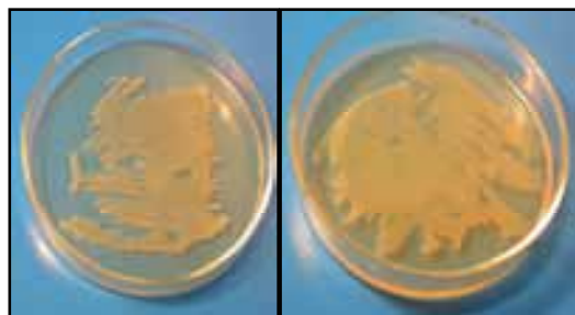
شکل ۲: نمونه‌هایی از کلنی‌های زرد رنگ رشد کرده در روی محیط

شکل ۲ نمونه‌هایی از کلنی‌های زرد رنگ رشد کرده در روی محیط TSA را در نمونه‌های مختلف نشان می‌دهد که از آنها برای تجزیه MTBE در غلظت ۱۰۰۰mg/L استفاده شد.