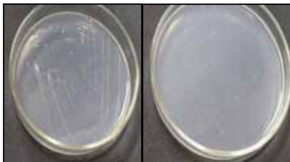
شکل ۱: کلنی‌های فراوان، بسیار ریز، متراکم و سفید متمایل به شیری

نشان می‌دهد. نمودار ۱ نیز بازده حذف MTBE با استفاده از سویه‌های تجزیه‌گر را نشان می‌دهد.