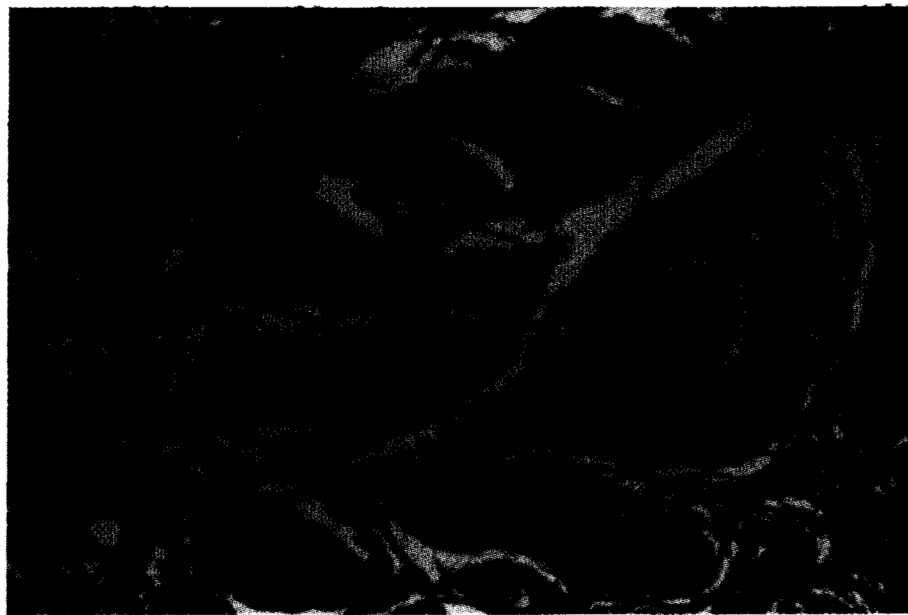
تصویر ۱ - فولیکولهای پوست بز کرکی رائینی (فولیکولهای اولیه و ثانویه) به همراه ضمام آنها در سه ماهگی (بزرگنمایی ۴۰۰X).

۴ - نسبت فولیکولهای ثانویه به فولیکولهای اولیه: تفاوت میانگین حداقل مربعات نسبت فولیکولهای ثانویه به فولیکولهای اولیه در سنین مختلف معنی‌دار نیست (جدول ۱). این نسبت از تقسیم تراکم فولیکولهای ثانویه به فولیکولهای اولیه به دست می‌آید. از طرفی با افزایش سن تراکم فولیکولهای اولیه و ثانویه کاهش می‌یابد. به عبارت دیگر با افزایش سن صورت و مخرج کسر با هم کاهش می‌یابند. بنابراین نتیجه به دست آمده قابل انتظار است (۲۳، ۱۹، ۱۳). اثر وزن سه ماهگی بر تغییرات نسبت فولیکولهای ثانویه به فولیکولهای اولیه معنی‌دار است ( p < 0/05 ) (جدول ۵). به عبارت دیگر با افزایش وزن سه ماهگی این نسبت افزایش پیدا می‌کند. همانطور که قبلاً توضیح داده شد با افزایش وزن