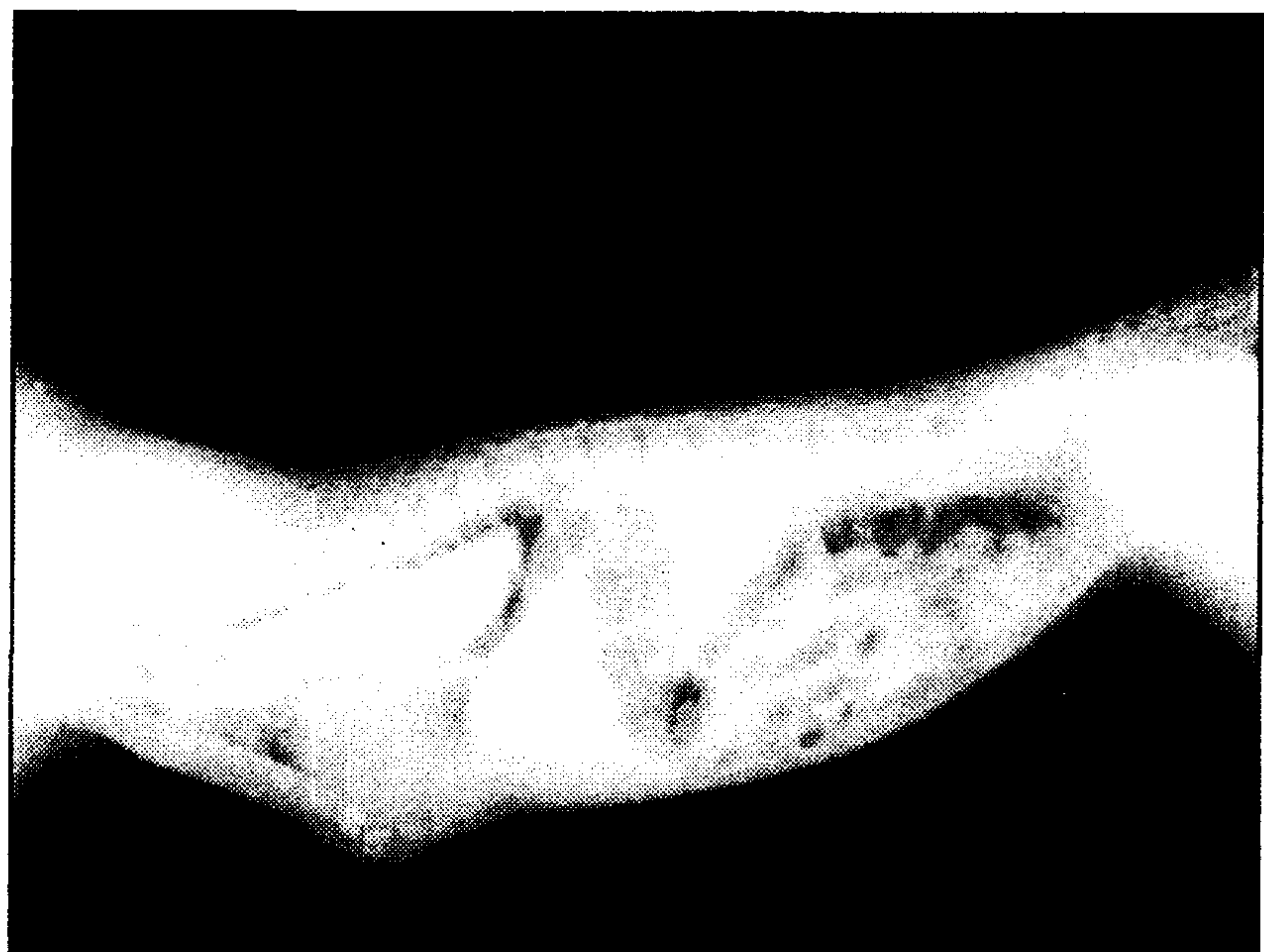
تصویر ۲ - رادیوگراف جانبی با سولفات باریم: محدوده اتساع مری توسط ماده حاجب مشخص گردیده است.