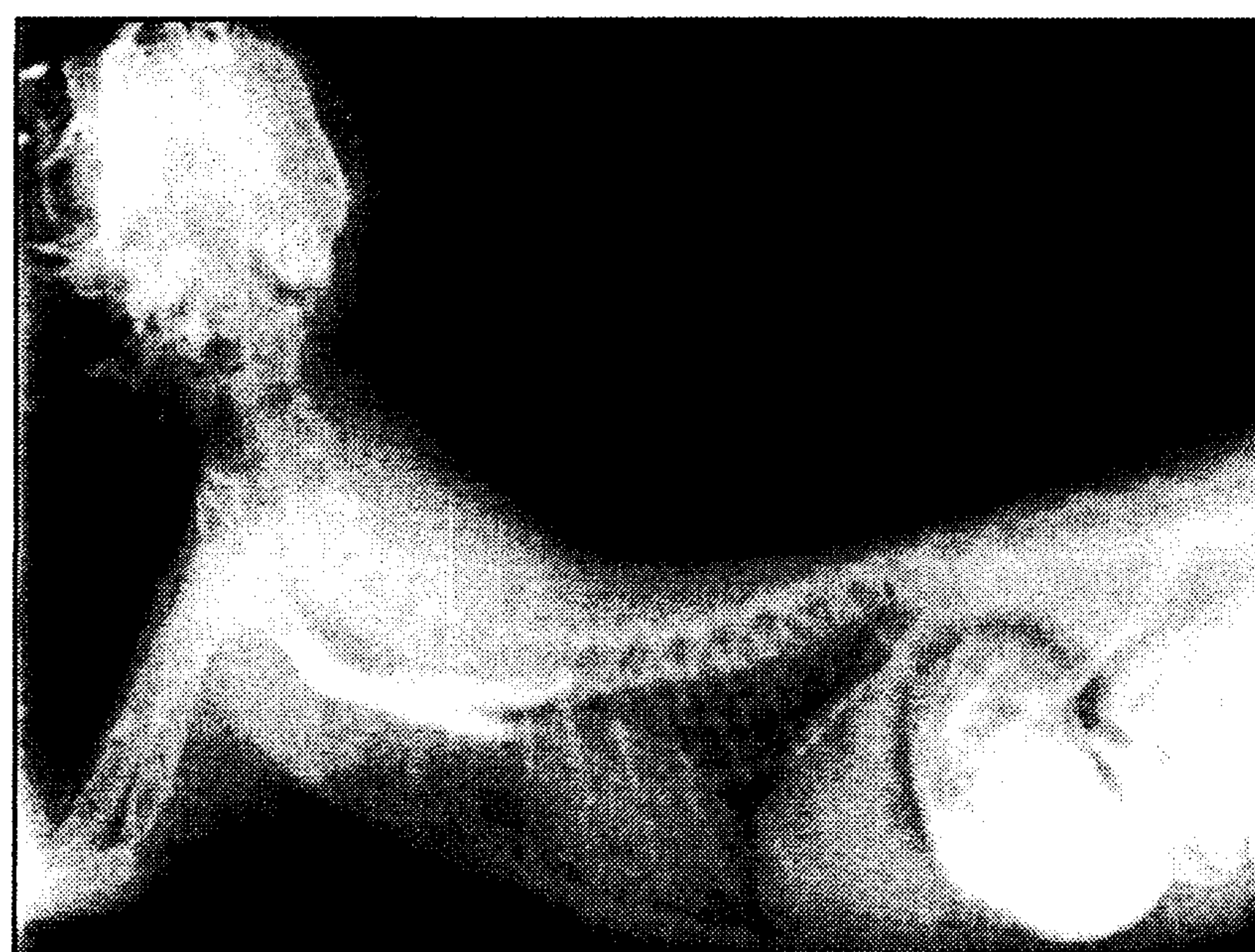
تصویر ۳ - رادیوگراف جانبی با سولفات باریم: کاهش علایم اتساع مری و بهبود انحراف شکمی نای، قلب و جناغ پس از ۲ ماه.