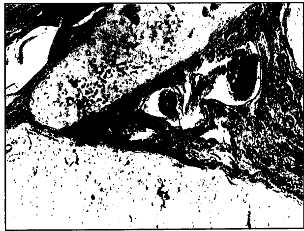
تصویر ۱- انتهای دو دیواره غضروفی در مجاورت هم قرار گرفته و در محل نقص غضروفی بافت همبند متراکم قرار دارد. غدد و وریدهای غاری در زیر محل نقص دیواره غضروفی مشاهده می شوند. رنگ آمیزی H&E. درشت نمایی ۴۰x.